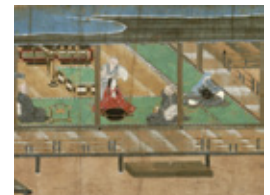
掃墨物語絵巻 徳川美術館蔵

● 企画展 やまと絵うるわし 日時/開催中~12月14日(水) 10時~17時 ※入館16時30分まで