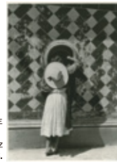
《舞踏家たちの城》1933年

日時/開催中~12月18日(日) 9時30分~17時 ※金曜日は20時まで ※入場は閉館30分前まで 料金/一般1,000円(800円)、 高・大生800円(600円)、 中学生以下無料 ※( )は20名以上の団体料金 休/月曜日