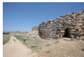
ティリンス遺跡城壁

日時/12月17日(土)~1月29日(日) 9時30分~17時 ※最終入場は閉館30分前まで 料金/一般800円(600円)、高・大生 600円(400円)、中学生以下無料 ※( )は20名以上の団体料金 休/月曜日(祝日の場合は開館、翌平日 が休館)、第4火曜日(ただし12月 27日(火)は特別開館)、年末年始