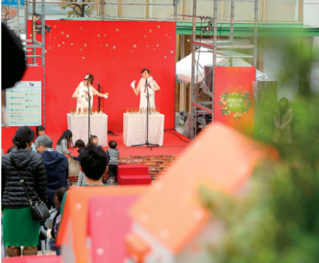
↑11月に開催された「クリスマスイルミネーションライブ@星が丘テラス」の様子。現場は大盛況!