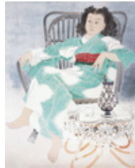
《鏡》昭和26年(1951) 滋賀県立近代美術館蔵 後期展示

日時/開催中~12月11日(日) 10時~17時 ※入館は16時30分まで 料金/一般1,000円、大学生700円、 中高生500円、 小学生以下無料 休/月曜日 ※祝日の場合は開館、翌平日が休館