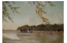
高橋由一(不忍池) 1880年頃 愛知県美術館

日時/開催中~12月18日(日) 10時~18時 ※金曜日は20時まで ※入館は閉館30分前まで 料金/一般500円(400円)、 高校・大学生300円(240円) 中学生以下無料 ※( )は20名以上の団体料金 休/月曜日