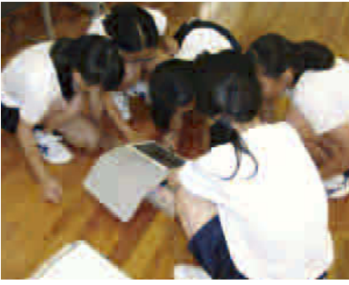
タブレットPCを使った学習