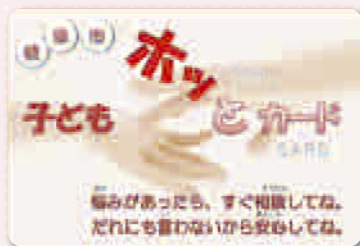
子どもホッとカード 子どもたちがいつでも相談できるよう、生徒手帳等に挟めるサイズになっています。