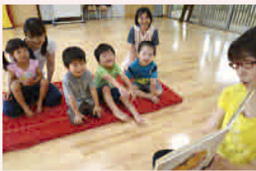
「あそび」を通して、ことばやコミュニケーションの力を育てる「幼児支援教室」

は250件以上あり、26年度と比較して約8.5倍の増加となりました。これは、市内の小・中・高の児童生徒に配布した「子どもホッとカード」の効果ではないかと考えています。 28年度は、広域連携として山県市や羽島郡岐南町も含め、約6万5千枚を配布し、子ども・若者総合支援センター「エールぎふ」の進化を図ります。