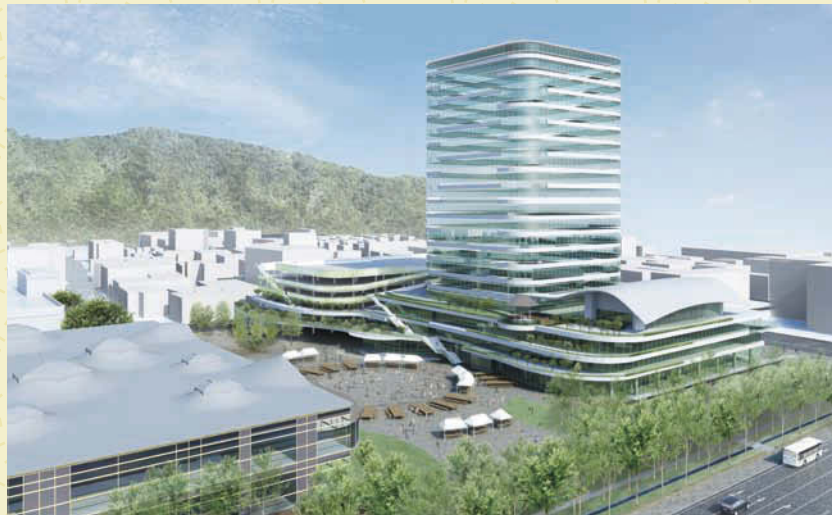
↑「みんなの広場 カオカオ」を中心に新庁舎を望む(イメージ)