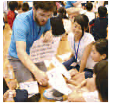
イングリッシュ・キャンプ in GIFU