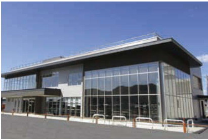
岐阜市長良川防災・健康ステーション 4月1日にオープン。平常時は市民の健康づくりの拠点として機能し、洪水時は指令室、水防倉庫などを備えた水防活動の拠点となる。