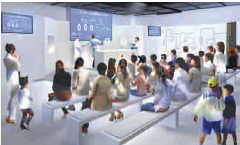
サイエンスショー（イメージ）

土日祝日に開催。 科学館の屋上天文台にて、太陽や金星・1等星などを天体望遠鏡で観察し、昼間に星を見る不思議な体験ができます。