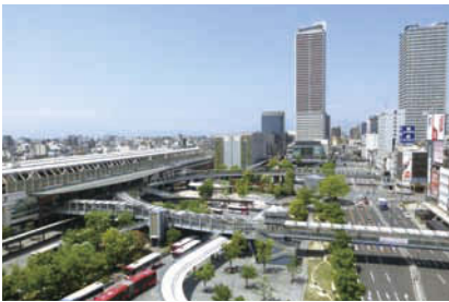
JR岐阜駅周辺 再開発により、めまぐるしく変わるJR岐阜駅周辺。駅とビルをデッキで結び、まちの回遊性を高めていく。