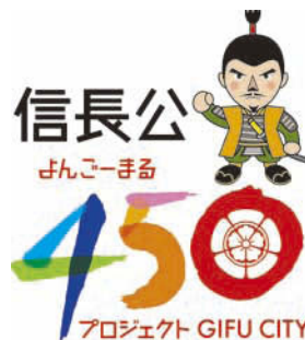
信長公 ぎんごまる 450 プロジェクト GIFU CITY 岐阜命名 四百五十年目のおもてなし —受け継ぐ信長公の心— 信長公450プロジェクトのロゴマーク とキャッチフレーズ

くような政策を構築していくた めに、副題を「個の復権、心の原 風景」としました。