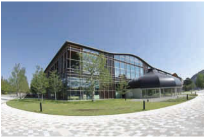
みんなの森ぎふメディアコスモス 平成27(2015)年7月にオープンした「みんなの森ぎふメディアコスモス」。岐阜市立中央図書館をはじめ、市民活動交流センターや多文化交流プラザが入り、にぎわい創出の拠点となっている。また、伊東豊雄氏が設計した図書館は、全国からの注目を集めている。