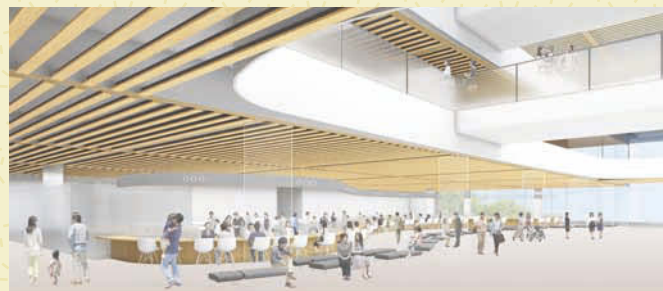
↑開放的なエントランスモールと一目で見渡せる窓口カウンター(イメージ)