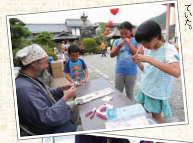
←手作りおもちゃのコーナー。ストロー笛をみんな上手に吹いていた。