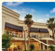
訪れたら、ファンになる。