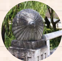
↑岐阜和傘の橋を探してみよう!