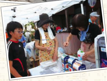
←この日は暑かったので、かき氷が人気だった。