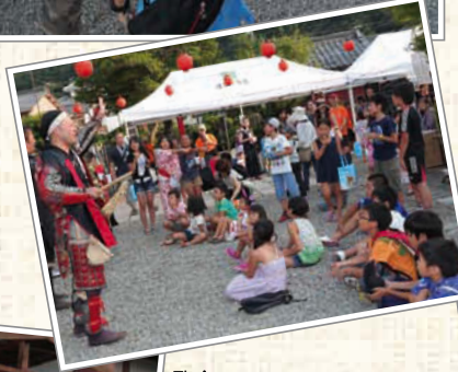
←夕方からはカラオケ大会。小さな子も一生懸命、歌っていた。