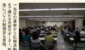
→当日の運営から広報活動まで携わる市民サポーター。能楽についての勉強会も実施。

融合で幕を開けた後は、お囃子の音が帯に響き渡り、幻想的な自然の中で伝統芸能が練り広げられます。