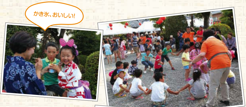
↑かごめかごめなど、昔ながらの遊びを楽しんだ。