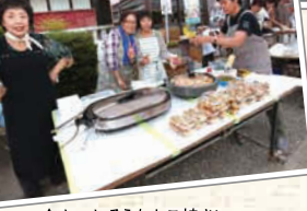
↑おいしそうなたこ焼き!