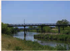
↑柳津町に緑地が広がる「境川」。