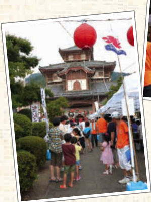
↑この日は暑かったので、かき氷が人気だった。