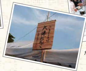
↑大佛だんごや五平餅は焼きたてを提供。