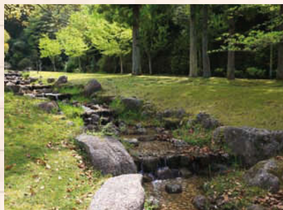
↑岐阜ファミリーパークの小川。小さな子ども安全に遊べる。