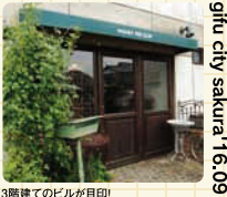
3階建てのビルが目印!