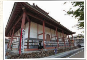
←大仏殿の周りにぐるりと飾られた行灯