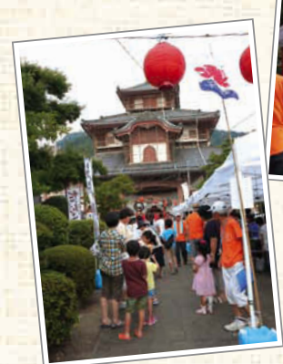
↑正法寺の境内が緑日の鬱陶気。