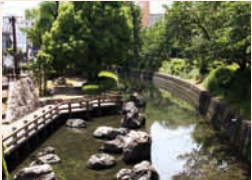
↑JR岐阜駅南から新荒田川に流れる「清水川」は、木栈橋や景石がある河川広場。まちなかの憩いの場所になっている。