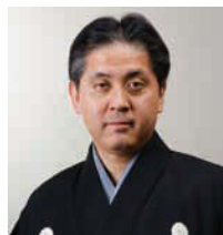
↑観世喜正 (観世流シテ方)