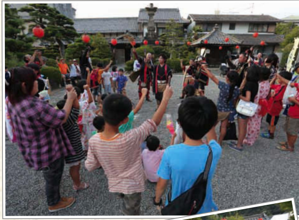
↑岐阜おもてなし武将隊 信義徹誠軍が登場! 子ども達と力いっぱい「えいえいおー!」と盛り上がった。