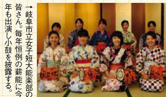
→岐阜市立女子短大能楽部の皆さん。毎年恒例の薪能に今年も出演し小鼓を披露する。