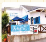
白壁の可愛いお店。