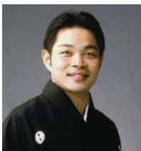
↑野村又三郎 (和泉流狂言方)

右／迫力ある平知盛の姿が目引く今年のビジュアル。ポスターやチラシも市民サポーターの皆さんの手で作られている。 左上／会場は長良川の沿岸に設けられた特設舞台。自然の風や音を感じながらの舞台は、能楽堂で見る能とはまた違った趣き。(今年の舞台より) 左下／能と狂言を披露する主な役者の面々。名高い役者たちの演技の迫力を生で見られる。