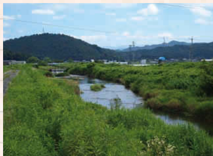
↑岐阜市の北西部を流れる伊自良川。流れが穏やかなので、川遊びが楽しめる。