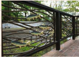
↑岐阜公園内の水路の柵には鮎が描かれている。