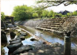
↑忠節用水放水路沿いにある「湊コミュニティ水路」。木製デッキの散策路や滝、親水階段などがある。