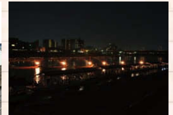
↑1300年前の伝統が息づく長良川鶺鴒。