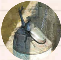
↑昆虫のモニュメントを見つけてみよう!