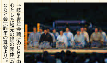
→岐阜青年会議所のBを心とした地元の話の団体みなもとと会（昨年の舞台より）。