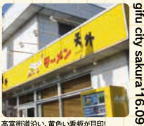
高富街道沿い、黄色い看板が目印!