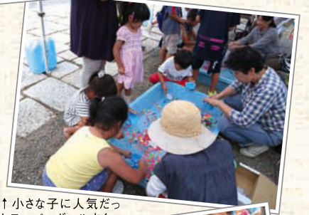
↑小さな子に人気だったスーパーボールすくい。