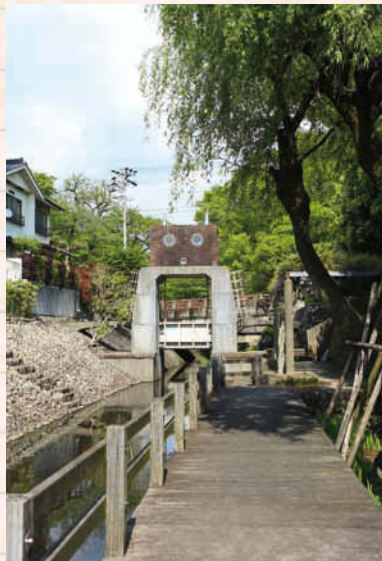
↑岐阜公園駐車場の入り口付近にある通称「ロボット水門」。忠節用水路の水量を調節するため、昭和8年に完成した「忠節用水分水樋門」。