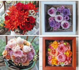
右/プリザーブドのフレームアレンジ(5,000円～)は宝物にしかたくなる可愛らしさ。左/生花の花束やアレンジも好みや要望に合わせて作ってくれる。

岐阜市長良5-8 Tel:058-294-6186 090-1980-7303 定休日:木曜、ほか臨時休業有り 営業時間:10:00～18:00 P:1台