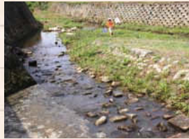
↑親水広場(打越)がある「戸石川」。