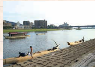
↑鶺鴒シーズンは風情ある長良川の風景を楽しもう!