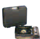
(一社)岐阜県LPガス協会岐阜支部賞 カセットファン風まる 各回2個