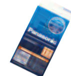
エネルギー単三電池4本+急速充電器セット 各回20個