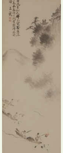
〔金華山と鶴図〕 原三溪筆 岐阜市歴史博物館蔵

原三溪 本名、原富太郎は1868(慶応4)年、岐阜県厚見郡佐波村(現岐阜市柳津町)で生まれる。17歳のとき上京、1891(明治24)年に横浜の生糸商、原善三郎の孫娘、屋寿と結婚。家業の生糸売込商「亀屋」を継ぐほか、富岡製糸場など、近代的な事業経営を行う。日本美術の収集や芸術家の援助を行うなど、芸術文化にも貢献。1939年(昭和14)逝去、享年70。