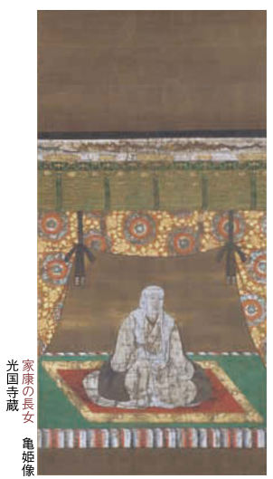
家康の長女 亀姫像 光国寺蔵