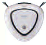
お掃除ロボットコース 各回1台