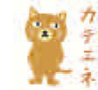
中部電力(株)賞 カテナポイント(2,000ポイント) 各回3名