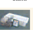
【外れた方にもWチャンス】リス興業(株)賞 緑のカーテン栽培セット 20セット