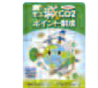
オリジナルQUOカード 各回50枚