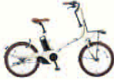
電動アシスト自転車コース 各回1台