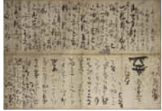
家康へ献上する 大久保長安蜂屋柿献上申付状 瑞林寺蔵

今でも名産になっている鮎鮎、蜂屋柿、真桑瓜は將軍家へ献上されていました。各展示品から、將軍家とつながっていた様子が見えます。