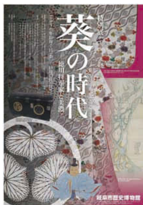
白繪子地卍立涌菊牡丹藤 模様打掛 伝和宮所用 徳川記念財団蔵

和宮の持ち物から江戸時代の華やかな世界を知ることができたり、生活に密着していた資料から今までとは違った角度で歴史の一部を垣間見られたり、小中学生向けのスタディツアーも行われるなど、たくさんの方の興味をかき立ててくれる特別展になります。