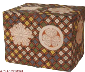
新出の和宮資料 葵葉菊紋付唐織油単 和宮所用 個人蔵