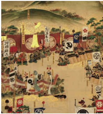
関ヶ原合戦図屏風(部分) 岐阜市歴史博物館蔵

加納城主の奥平信昌は、徳川家康の長女、亀姫の夫。亀姫は家康の正室の長女ということもあり、とても敬われていた人物で、徳川將軍家と加納藩は強い結びつきがあったと言われています。