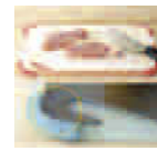
岐阜プラスチック工業(株)賞 クリップボード&ハングシートセット 各回2セット