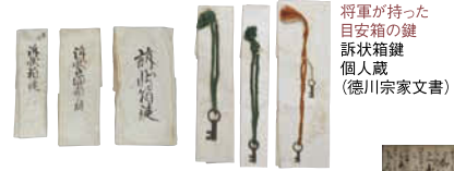
將軍が持った 目安箱の鍵 訴状箱鍵 個人蔵 (徳川宗家文書)

全国に置かれていた目安箱の鍵を展示。美濃の人が江戸で投書した訴状文も展示されます。