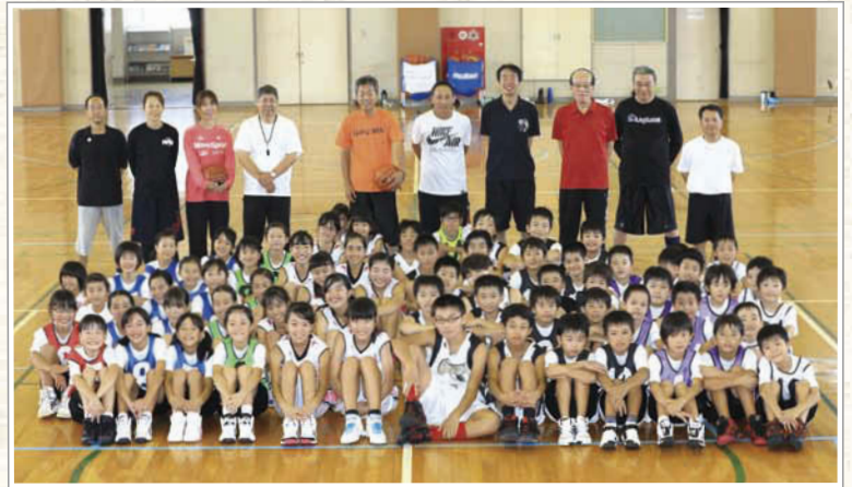
→全メンバー74名が毎週、基本技術を身につけるため、やる気いっぱい練習をしている。