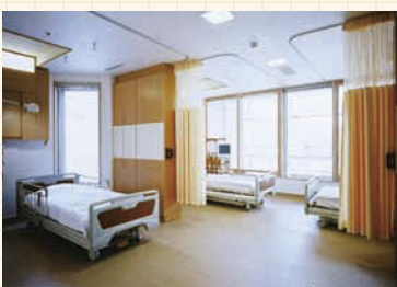
4床病室は全てのベッドに窓を配置。病室はプライベートやゆとり配慮されている。