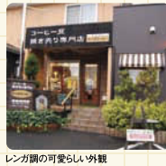
レンガ調の可愛い外観