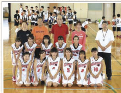
↑6年生女子チームのメンバーは13名。とにかく楽しさが溢み出ていました!

現在、5年生女子、4年生、3年生のメンバーを若干名募集中。来年度の新3年生の入学については来年、岐阜市広報(2月15日号)などで募集します。