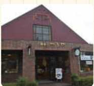
和菓子の世界を満喫