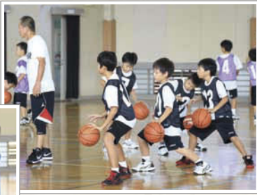
→これからますます成長が期待できる5年生メンバー。

丁寧な指導のもと、岐阜市内の小学生がバスケットボールの練習をする「岐阜市ミニバスケットボール教室」は約25年間、岐阜市で続けられている教室です。 中学校や高校へ行って部活などでスムーズに取り組めるよう、練習は基本的な技術力を身につけることをメインにしています。練習は1週間に1回ですが、登録コーチの人数が15名ほどと多く、しっかり練習をすることができ、勝ち負けにこだわらず、仲間とスポーツをすることやバスケットボールの楽しさを知ってもらうことも大切にしています。