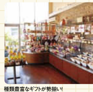
種類豊富なギフトが勢揃い!