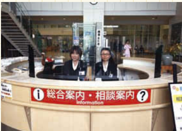
病院正面玄関を入ったすぐの「総合案内」では、さまざまな相談を受け付けている。総合案内・相談受付／平日8時30分～17時