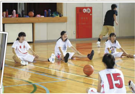
←練習中は仲間同士の声かけや励ましあう姿も見られお互いを高め合っている。