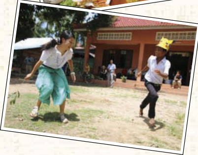
←ユネスコが建てたりんご園。寺子屋で子どもたちとゲーム。