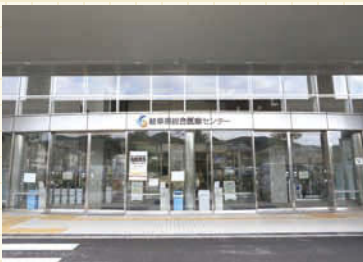
広々としたエントランス。車椅子の乗り降りもスムーズ。