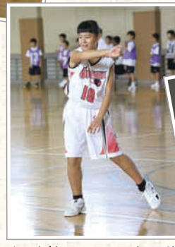
↑真剣にやるからこそ楽しい練習。仲間と協力しながら上達していく6年生女子チーム。