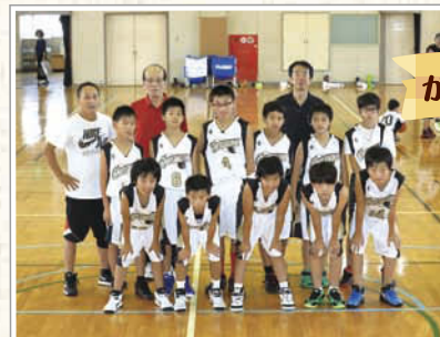
↑6年生男子チームのメンバーは12名。パワフルに技術を磨いています。