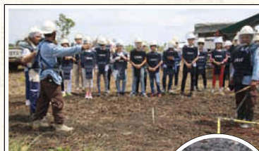
↑緊張感に包まれながら、地雷除去現場を見学。除去のための爆破音に言葉も出なかった研修生たち。