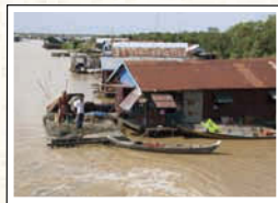
←東南アジア最大の湖、トンレサップ湖。水上生活者のお宅を訪問し、カンボジアにも大きな貧富の差があることを知った。