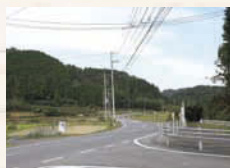
↑ 県道79号から雑倉の集落へ入る入り口付近にある夫婦岩。宝蔵寺の西側にある。