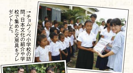
←チムンブップ小学校の訪問。日本文化の紹介や学校で集めた文房具をプレゼントした。