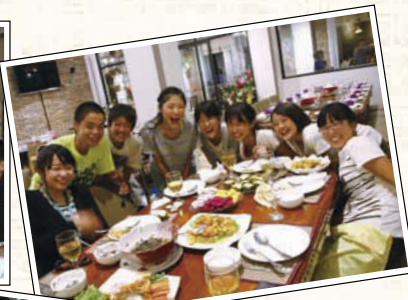
←カンボジアの食文化を体験。おいしい料理からヒナにかえる寸前のアヒルの卵やサソリなども口にした。