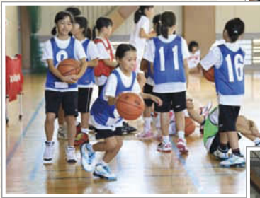
↑シュートが決まると嬉しい！バスケットボールの魅力を知っていく3、4年生メンバー。