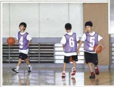
←3、4年生チームの練習は和気あいあいと楽しそう。