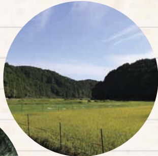
↑ 水田が多く、はっきりと里山の四季を感じられるエリア。