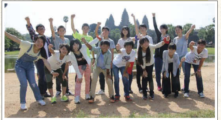
↑世界遺産アンコールワットを見学。圧倒的な存在感に感動!

JMAS：認定特定非営利活動法人 日本地雷処理を支援する会 CMAC：カンボジア地雷対策センター