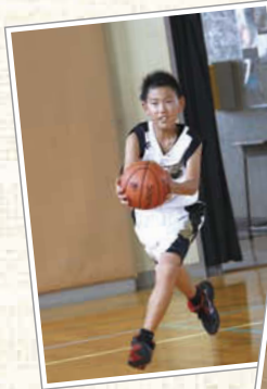
←6年生の男子は迫力満点。練習中はスピード感いっぱい!