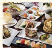
遊びやかな大人の時間を...