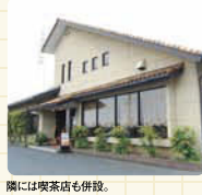
隣には喫茶店も併設。