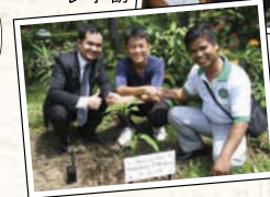
←宿先のホテルのご好意で、マンゴーの木を植樹。大人になって自分の家族とここを訪れる、と誓った。