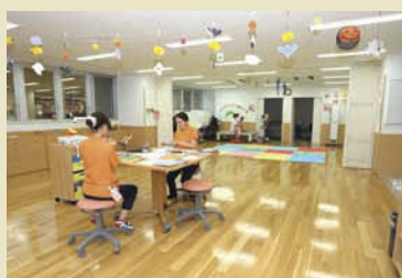
施設の壁や天井には季節を感じられる装飾がされ、明るく楽しい雰囲気。

特別な医療が必要な子どもを専門的な知識をもった看護師や介護福祉などがケアをするため、家族も安心。家族と一緒に参加できる行事を計画するなど、親子のつながりを持つことや、同施設を訪れる人が心地の良い時間を過ごせるよう考えられています。