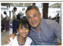
↑空港やホテル、アンコール遺跡群などで、外国人に英語で岐阜市を紹介した。