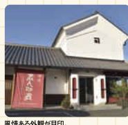
風景ある外観が目印。