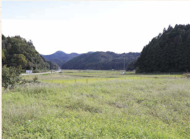
↑ 雑倉の風景。豊かな動植物がすんでいる。