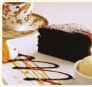
ケーキセットもおすすめ。