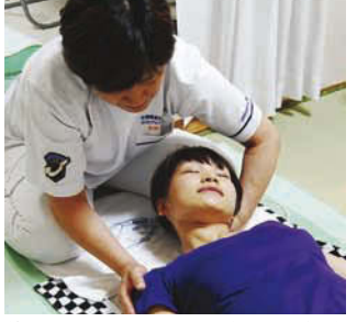
首から背中のハリにも効果的。他にも、骨盤・小顔調整付きフェイシャルエステも大好評。美姿勢も手に入り、透明美肌もゲット!

岐阜市北一色10-26-8 エクセル澤田101 Tel:058-249-5233 定休日:日曜日 営業時間:10:00~21:00 (最終受付20:00) P:4台完備