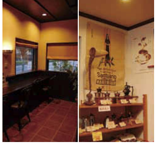
暖かい照明が心安らく喫茶スペース。地域の方々の憩いの場になっています。店内では、コーヒーミルやポットの販売も行ってます。自宅で本格的にコーヒーデビューなんてのもアリかも?

岐阜市野一色4-13-11 Tel:058-240-2239 定休日:日曜日、祝祭日 営業時間:9:00~18:00(喫茶LO.16:30) P:有