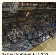
フォルムいろいろめがね&サンGLAS.