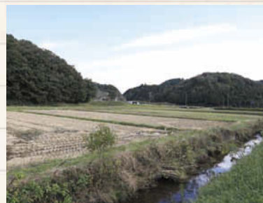
↑ 水田のすぐ横を流れる雑倉川。川には豊富で多種多様な栄養が流れ込むため、たくさんの種類のいきものが生息している。