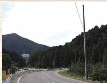
↑ 県道79号から「掛洞プラント」方面を向いた景色。掛洞プラントの向こう(西側)に見えるのが祐向山(ゆうこうやま)。高さは374.3mで、岐阜市で2番目に高い山になる。本巣市の「文殊の森公園」から登ることができる。