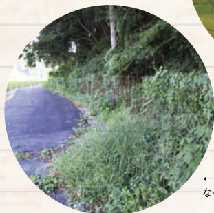
← 東海自然歩道のルートになっている雑倉地区。