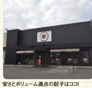
安さとボリューム満点の餃子はコレ!