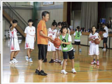
↑5、6年生の女子チームと一緒に練習。