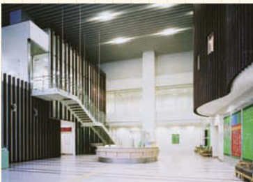
開放的なロビー。受付、支払窓口、自動精算機などが設置されている。