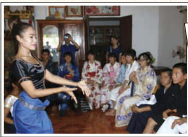
↑アプサラダンススクールを訪問。一緒に合唱をしたり、アプサラダンスを見たりして、日本との文化の違いを感じた。