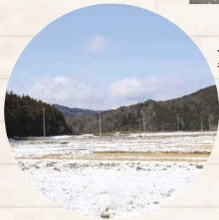
← 雪が降ると静寂に包まれる。冬の季節も訪れてみたい。