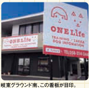
岐阜グラウンド南、この看板が目印。