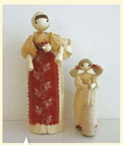
どうもこの皮などで作られている「どうもこし人形」は、スロバキアの代表的なお土産のひとつ。

ホストタウンについて学ぼう! 20年東京オリンピック・パラリンピック 岐阜市×スロバキア ホストタウン交流を推進 梅雨も明けてすっかり夏じゃのう! 毎日暑い日が続くが、元気に過ごしてらるか? 学生のみんは夏休みの真っ最中じゃなく、涼しく勉強したい子はメディアコスモスへおいで☆さあ今回は岐阜市と外国の関係について紹介するぞ! ホストタウンって知ってるかの?