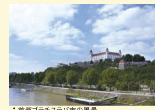
↑ 首都ブラチスラバ市の風景(ドナウ川とブラチスラバ城)