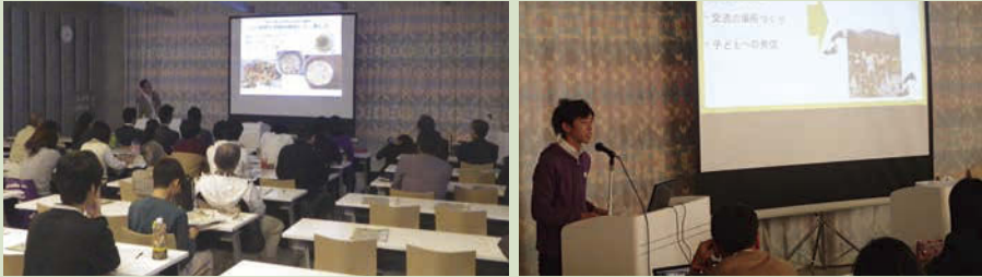
↑ 昨年の様子(基調講演)