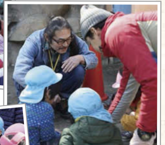
おじさんたちが見守ってくれるので安心して体験できた子どもたち。