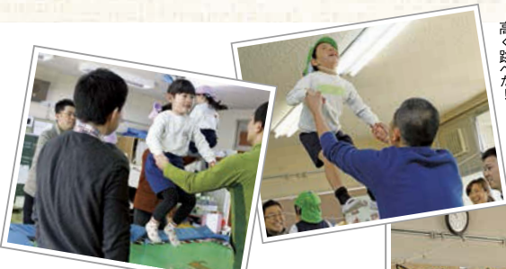
天井に付きそうなくらい 高く跳べた!

おじさんたちが子どもたちの 手をとって安全にジャンプ。 いつもより高く 跳ぶことができました。