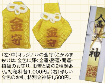
(左・中)オリジナルの金守(こがねまもり)は、金色に輝く金運・勝運・開運・招福のお守り。巾着と袋の2種類あり。初穂料各1,000円。(右)珍しい金色のお札。特別金神符1,500円。