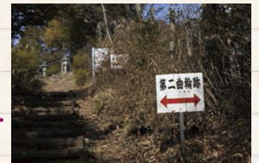
↑三井城址の曲輪(くるわ)がほぼ原型を保っている。