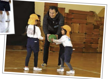
おじさんたちも久しぶりのドッジボールを楽しんだ。