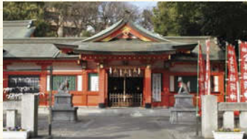
本殿の東側にある金祥福荷神社は金運と商売繁盛の神様。