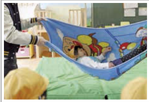
体ごとゆらゆら揺られて気持ちよさそう。