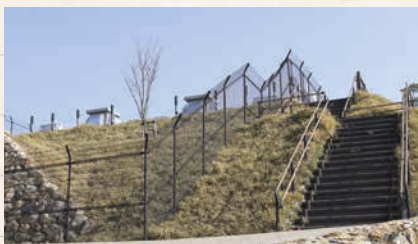
↑開けた場所に広場がある。