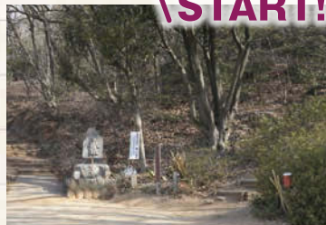
↑登山口は新境川にかかる赤い三井龍神橋の近くにある。今回は左手の登山口に行く。