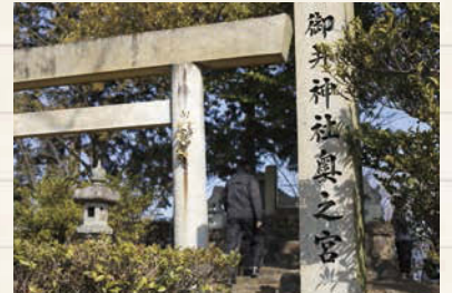
↑頂上には御井神社の奥の院もある。かつてはここに本殿があったとされ、山全体が信仰の対象だったようだ。