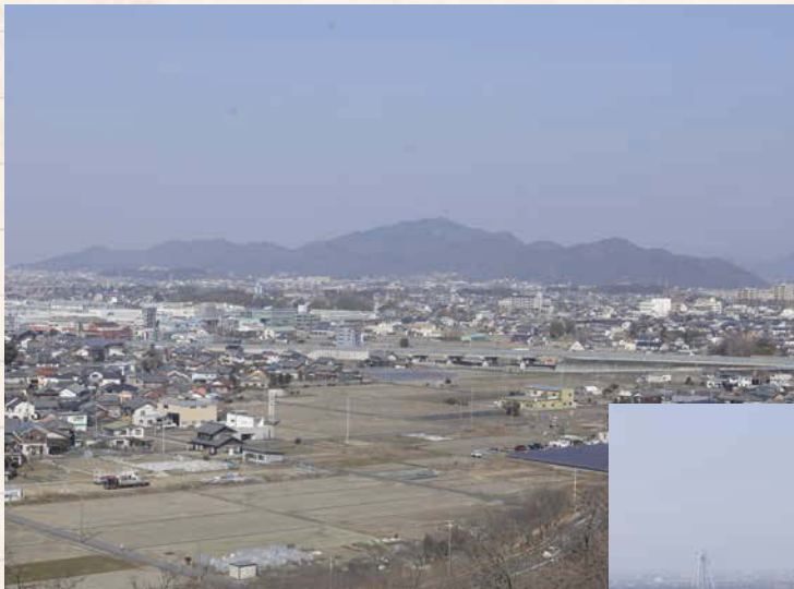
↑広場からは広々とした風景が眺められる。正面に見えるのは金華山。