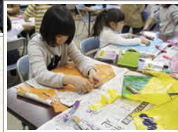
自分でできるところは自分で。みんな意欲的に取り組んでいた。