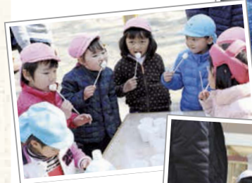
寒い中で食べる 焼きマシュマロにみんな夢中。