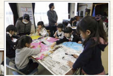
ペンの譲り合い、順番待ちをしながらタコに絵を描いた。