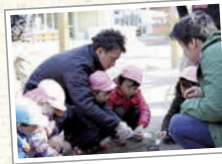
「この位置で焼くと焦げ目がつくよ」

炭をおこして、 子どもたちと一緒にマシュマロ焼き。 上手に焼けるように、おじさんたちが 優しく子どもたちに声をかけていました。