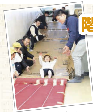
おじさんたちが見守る中、安全に 楽しむことができました。

階段を利用した ダンボールすべり台。 おじさんたちの力で ドキドキできる、 楽しいすべり台が できました。