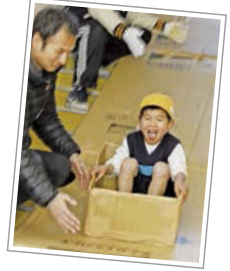
箱型ソリで一気に滑り降りる！