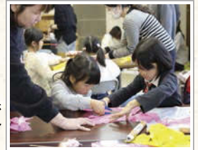
体験者と少女スカウトさんがペアになり、協力しながら仕上げていった。