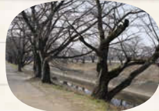
↑新境川沿いは桜並木になっており、春の美しい風景に期待ができる。