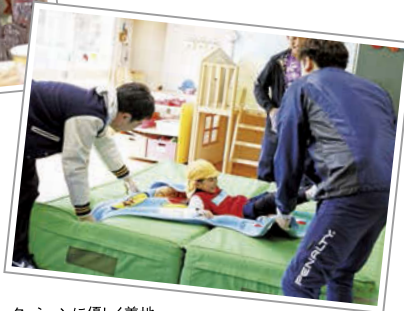
クッションに優しく着地。