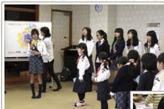
相手にしてもらって嬉しかったことを発表。