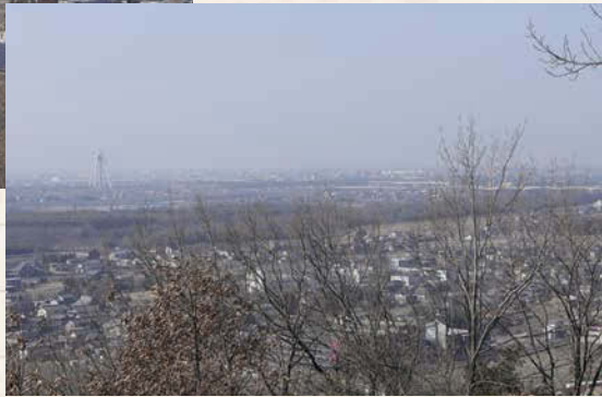
↑頂上の展望台からの眺め。西にツインアーチ138が見える。