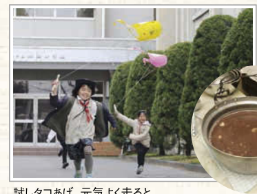
試しタコあげ。元気よく走ると、タコも元気よくあがった!