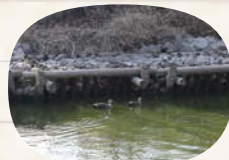
↑カモの姿を見ることができた。