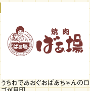
うちであおぐおばあちゃんのココが目印。