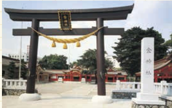
昭和63年、社殿が新しく造営された時の写真。岐阜市民にとっては懐かしもある、金色に塗り替えられる前の大鳥居。

お祭りやイベントを楽しむもよし、静かな気持ちで手を合わせるもよし。春の訪れを感じながら、こがねさんへ参拝に出かけませんか？