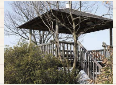
↑頂上には展望台が設置され、南、西、北の景色が楽しめる。