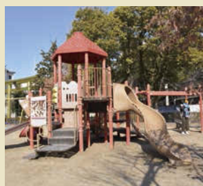
地元の子どもの遊び場。

【Premium金Day】 毎月最終金曜日 今回は3月30日(金) 初穂料300円