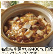
名鉄岐阜駅から約400m、円徳寺とセブンイレブンの間。