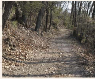
↑広場からもう少し歩くと、頂上へ。