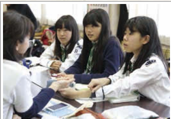
シニア、レンジャーの少女は旅行の計画。

ガールスカウトでは、幅広い年齢のスカウトさんが一緒に活動しているため、小さな子はお世話してもらおう優しさを感じながら、お姉さんたちへの憧れをもつことができます。ガールスカウトの活動に参加することで、自分で考え、意欲的に行動できる大人へと成長していくことでしょう。