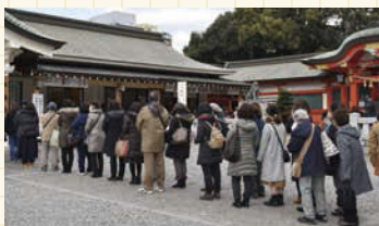
2月の最終金曜日。この日も多くの方が金の御朱印目当てに集まった。