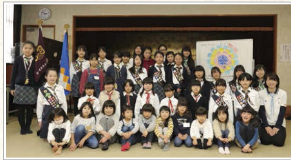
年齢別にブラウニー(小学低学年)、ジュニア(小学高学年)、シニア(中学生)、レンジャー(高校生)に分かれ、発達段階に合わせた活動をする。成人はリーダーとして、少女たちの育成のほか、新しい自分への挑戦、よりよい未来をつくるための活動をしている。

<取材協力> ガールスカウト岐阜県第3団 活動日時:主に第1・2・4日曜 活動場所:岐阜市加納東公民館 (岐阜市加納西丸1-73-2) 問い合わせ:Tel.058-274-2550(堀団委員長) tompomcherry@gmail.com ◎団員募集中。見学、体験お待ちしております! 詳細は…… Facebook[ガールスカウト岐阜県第3団]で検索。