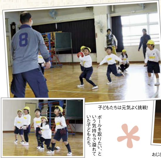
子どもたちは元気よく挑戦！