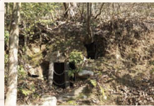
↑三井山古墳。古墳時代後期の横穴式石室。