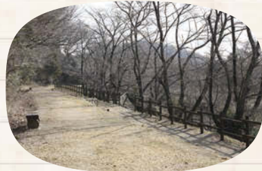
↑池の周囲は遊歩道になっており、散歩できる。