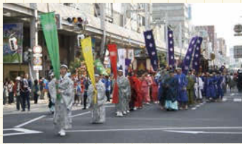
神幸祭の様子。お神輿を担ぐ人も見る人にも熱い息吹が湧き、一帯に活気が溢れる。