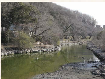
↑三井山の麓には三井池があり、池を中心に公園が整備されている。