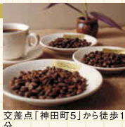
交差点「神田町5」から徒歩1分。