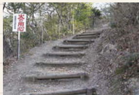
↑階段が整備されている登山道。