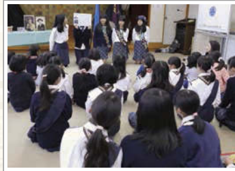
シニア少女の進行で「ワールドシンキングデイ」にちなんだクイズが行われた。

また、この日は「ワールドシンキングデイ」のセレモニーも行われ、体験者も一緒にクイズに参加し、