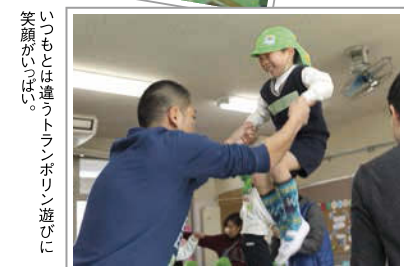
いつもとは違うトランポリン遊びに 笑顔がいっぱい。

クロスメディア・コミュニケーションを最適化! あなたの戦略と技術で広告効果を最大化!