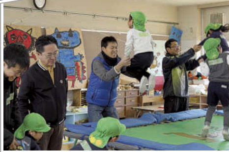
自分のお父さんではないおじさんとも楽しく、仲良くジャンプ。