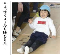
ちよびりスリルを味わえた！

最後は「たから探し」。保育室に隠 れている宝物カードを見つけてプ レゼントをゲット！