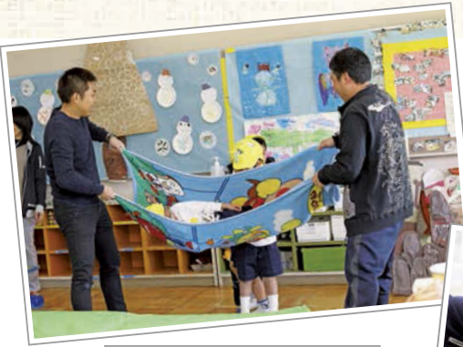
力があるおじさんならではの遊び。