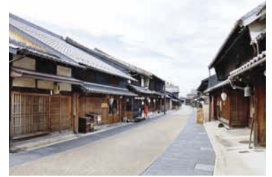
岐阜市川原町の街並み

県民の皆さんがアートに身近に感じ、参加するきっかけとなるような岐阜県ならではの体験型プログラム「アートラボぎふ」をスタートしました。年間を通して、「面白そう」「ちょっと覗いてみたい」と思っていたいただけるようなプログラムを県内各地で展開します。