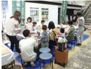
山の日フェスタぎふのワークショップ (アクティブG)