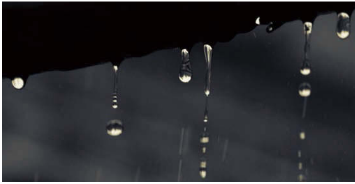
by Malinda Rathnayake