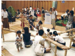
ぎふ木育キャラバン (ぎふ清流文化プラザ)

8月第2週を「ぎふ木育WEEK」として、8月5日(日)からぎふの山や自然を知り、味わい、楽しんでいただくためのイベントを開催します。