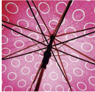
by Johnny Ainsworth