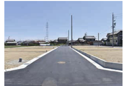
建築条件無し!生活環境の整った好物件。

〒岐阜市中1丁目41番地1他 岐阜バス「中2丁目」停車徒歩3分 敷8区画 画8区画 価680万~750万円 諸上下水道引込工事432,000円(受益者負担金230/㎡) 田214.06㎡(64.75坪)~214.89㎡(65.00坪) 窓50% 窓60% 窓200% 園宅地 団第一種中高層住宅地域 園西側公道6.5m、北側公道5.7m 園岐阜市指定ま開第1号の145【売主】