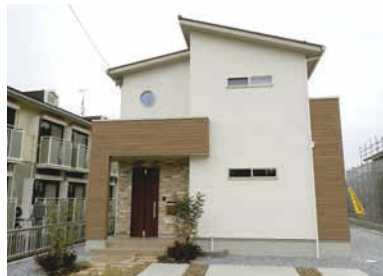
シンプルで上品な佇まい。おしゃれな小窓が明るい家を演出。

〒岐阜市粟野西8丁目1番1 岐阜バス「粟野西6丁目」停約110m 敷6区画 画1区画 価2,430万円(税込) 諸上下水道取負担金25万円別途 田231.51㎡(70.03坪) 建117.59㎡(35.57坪) 窓50% 窓80% 障木造ガルバリウム鋼板葺2階建 宅地 団第一種低層住居専用地域 西側幅員約4mの市道に約11.7m接する 園公共上下水道、中部電力(オール電化) 園平成30年3月【売主】