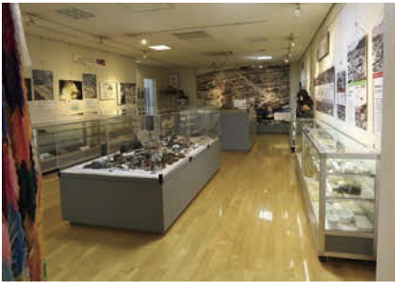
【岐阜市平和資料室】 岐阜空襲当時を色濃く残す品々を展示。平和への願いを新たにす るきっかけになるでしょう。岐阜空襲を記録する会は「岐阜市平和資 料室」展示企画・運営団体の指定を受けている。 所／岐阜市橋本町1-10-23 ハートフルスクエアG(2階) 時／9時～21時 休／毎月最終火曜日、年末年始