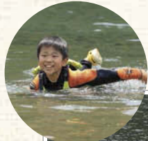
安全に遊びながら川の様子も学ばせてあげる。