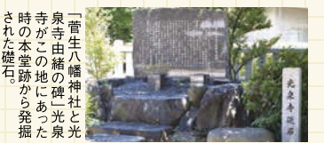
「菅生八幡神社と光 泉寺由緒の碑」光泉 寺がこの地にあった 時の本堂跡から発掘 された礎石。