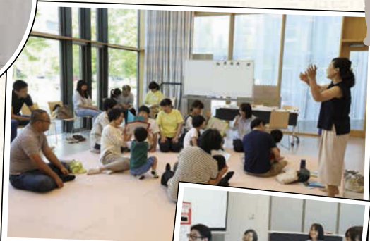
みんなで声を合わせて朗読。子どもも大人も、障がいがあってもなくても、一緒にお話や絵本を楽しむ。