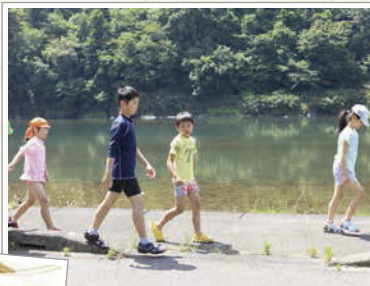
活動場所から川沿いを歩き、 鴉之瀬橋を渡って鴉匠さん の家へ移動。