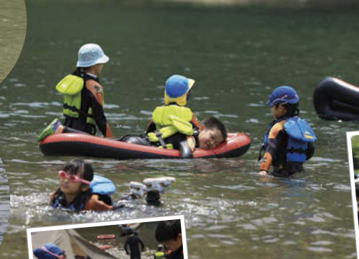
食材を手際よく調理。