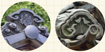
神社の瓦には、祭神や神使、ゆかりのある紋が使われる。