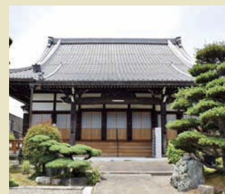
浄土真宗本願寺派 光泉寺 所／瑞穂市別府467-1

光泉寺所蔵の「菅生旧記」に よると、菅生院の隣地に八幡大 菩薩を勧請し、本地仏阿弥陀如 来を安置したとあり、神仏習合 として菅生八幡神社と光泉寺 は密接な関係にあったようです。 光泉寺は平安時代の弘仁年 間(八〇〇〜八二四)に菅生の地 に弘法大師によって創建。寺号を 花中山光明寺、また菅生院とも 称し、真言宗寺院として栄えま す。そして、室町時代に浄土真 宗寺院となったことより伽藍が 焼却される災難にあい、本業郡 前野村に移ります。江戸時代に 境内の泉の池より光明が輝く 奇瑞から寺号を現在の光泉寺 と改め、水害を避け現在の地に 移転したと言われます。