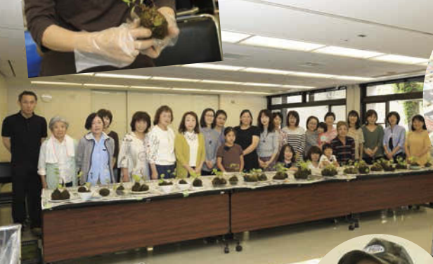
参加者のみなさん。応募者多数で、大人気の講座となった。