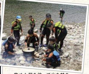
集めた薪を使って火を焚き付けて調理準備!