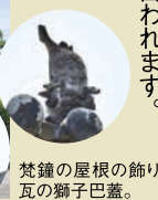
梵鐘の屋根の飾り 瓦の獅子巴蓋。