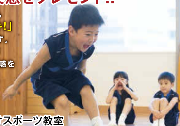
幼児・児童向けスポーツ教室

ラボの合言葉はいつも 「わくわくドキドキ!!」 そして、「感動!」です。 忍者さんひとり一人が 「できる!」という実感を 楽しんでいます。