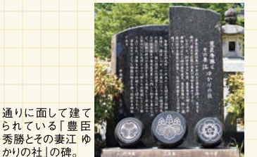
通りに面して建て られている「豊臣 秀勝とその妻江 ゆかりの社」の碑。