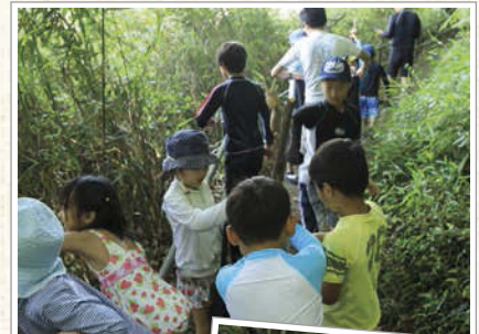
川岸の藪の中で薪拾い。小さい子が薄暗い場所を怖がっていたので、上級生が率先!