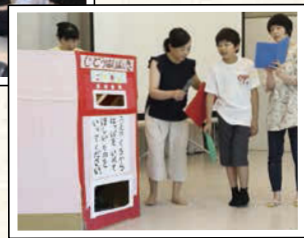
7月21日に開催される、「はじめまして」のおはなし会のステージで発表する「ぼんたのじどうはんばい」を練習。本番が楽しみ!

障がいのある方とその家族が 気兼ねなく参加できる会 ハッピー・ハーモニーは障がいのあ るなしに関わらず、みんなが気兼 ねなく、和気あいあいと参加でき る余暇の場をつくる任意団体。 「本物生」の楽しさと喜びの体感 を大切にしています。 「みんな de えほん」は、参加者 みんなで絵本を楽しむ会です。 子どもも大人も、障がいのある方 もない方も気軽に参加でき、みん なで声を揃えて掛け声をかけた り、体を揺らして歌を歌ったり、 たっぷりハッピーな時間を過ごし ます。ナビゲーターはフリーアナ ウンサーの浅井彰子さん。発達心 理学の分野で乳幼児心理判定員 を務め、絵本が大好きで本屋さ んのような部屋で暮らしているそ うで、この企画にびびったり。優しく て包み込まれるような声でみん