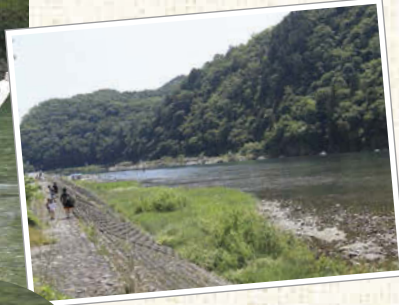
川の上で思いの過ごし方をしていた。