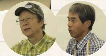
講師を務めた「NPO法人ふれあいの森自然学校」のみなさん。

↑参加者が作ったこけ玉。初めて制作する人も多かったが、1個、2個と作るうちにコツを掴み、愛着のある作品になった。