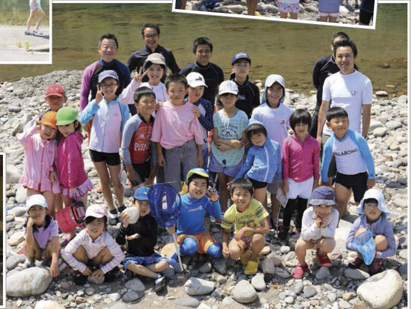
この日は小学生から中学生まで幅広い年齢の子どもたちが集まった。