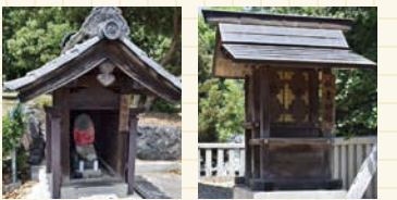
昭和9年6月15日に境 内社として合併した秋 葉神社。