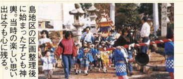
鳥地区の区画整理後 に始まった子ども神 輿。当時の楽しい思い 出は今も心に残る。