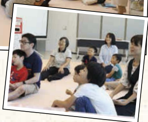
みんなあっこさんの朗読に集中して聞いていて、楽しそう。