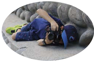
長良川と一緒に金華山の頂上も入れたいから寝転んでみた!