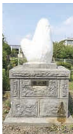
↑昭和46年度に建てられた歯の塔。「納歯式」では、この日までに保管していた乳歯を歯の塔に納める。