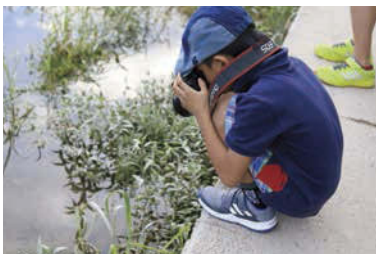
長良川のいきものが気になる!小さな魚が泳いでいるよ!