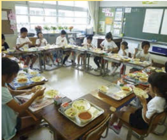
↑なかよし班で食べるなかよし給食。笑顔がいっぱいの楽しい時間に！