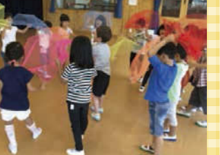
のびのび体を動かし、とっても楽しそう♪

「子どもは大人と違って、ありのままをありのまま受け入れられます。困り感を抱えている子がいたら、じゃあ僕が手伝うよと手を差し出す。そんな自然で優しい光景が当たり前にあります」 毎日の生活の中で、自分で選び決定し、それを受け入れてもらえる安心感。園生活で自信をつけ、広く優しい心をもつ子どもたちの輝く未来に、思いを馳せずにはられません。