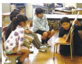
↑中学生による読み聞かせも！

地域の方からはほかにもたくさんの方から行事や学習への協力、農園の貸し出しや竹材の提供などもあり、地域のみなさんが児童の成長を見守っていること、また、学校を支えていることが分かります。