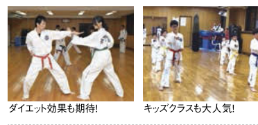
ダイエット効果も期待! キッズクラスも大人気!

運動不足な身体を鍛えたい、楽しく効率的にダイエットがしたい!子どもに礼儀を学ばせたいお子様から社会人まで、楽しくレッスンできます。