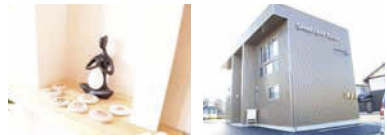
自分と向き合う時間を大切に。 駐車場完備で楽々通える!

厳しい条件を満たした上でヨガアライアンス認定校として登録。独自にカリキュラムを組み、それぞれの指導理念・指導方法に則り独自の指導者トレーニングを開催。トスキルアップにも◎。