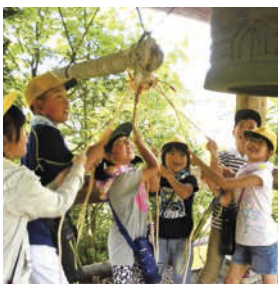
↑みんなで力を合わせてがんばった「ウッキッキウォークラリー」。

地域をめぐる「ウッキッキウォークラリー」もなかよし班で行います。仲間同士で助け合いながらチェックポイントを周ることで仲間との絆を深める活動となっています。