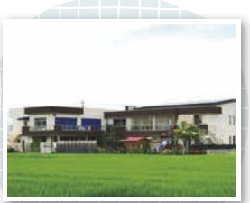
「心の育ち」を重視したこだわりポイントがたくさん詰まった園舎。子どもはもちろん、保育教諭にもやさしい空間。

「子どもは大人と違って、ありのままをありのまま受け入れられます。困り感を抱えている子がいたら、じゃあ僕が手伝うよと手を差し出す。そんな自然で優しい光景が当たり前にあります」 毎日の生活の中で、自分で選び決定し、それを受け入れてもらえる安心感。園生活で自信をつけ、広く優しい心をもつ子どもたちの輝く未来に、思いを馳せずにはられません。