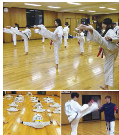
基本から丁寧に教えてもらえるので初心者でも安心!

Recommend オススメ 身体も精神も健康に! まずは体験へ! 大人クラス・キッズクラス 月会費6,000円→ 1ヶ月無料体験レッスン★ 営業日なら、お好きな日にお好きなだけ通って頂けます!