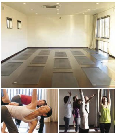
広い空間のパウダールーム・男女別更衣室完備。

癒し・健康・シェイプアップ...様々な目的を持った生徒さんが若者男女問わずいらっしゃいます。皆でヨガの楽しさを学びましょう!定期的に開催するイベントは大人気のため早めのお問い合わせがおすすめです。初めての方大歓迎!