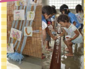
流しそうめんやお化け屋敷などを年長さんが手作り。小さい子たちはお客さんとして楽しみました。