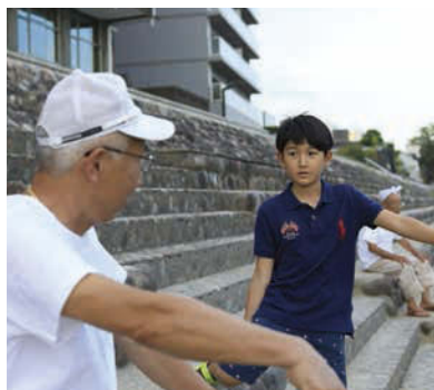
鵜飼観覧船の船員さんにインタビュー。