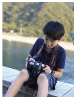
上手に撮影ができたこの写真にしよう!

たくさん撮影した長良川の風景。掲載スペースは限られているので、この中から数枚、写真を選びます。取材で分かったことなども読者に上手に伝えられるよう、文章にします。