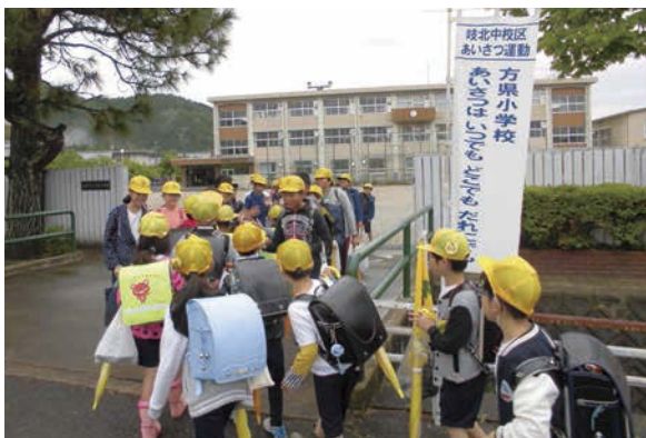
↓あいさつ運動の様子。登校してくる児童と優しいタッチであいさつをする。

中でも、積極的に取り組んでいることは、「自分から元気にあいさつをする」ことです。朝はあいさつ回りと言って、児童が職員室や教室を回ってタッチをしながらあいさつをします。