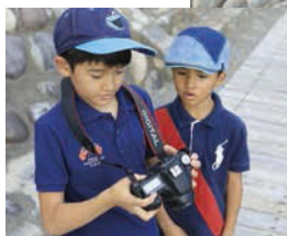
カメラの使い方を覚えました。