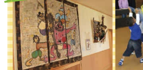
みんなで作った共同作品には、キャプションボードを掲示し、まるで美術館のようにディスプレイ。