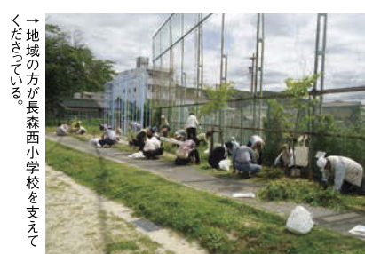
→地域の方が長森西小学校を支えてくださっている。