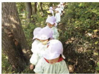
↑「大洞の里山つくり会」の皆さんと一緒に、すぐ裏にある里山を探索♪