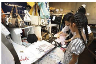
Tシャツも同じように並べてみよう。