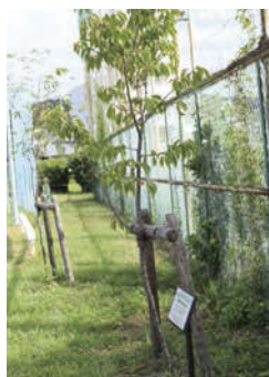
一新た植樹されたヤマザクラ。今後、桜の種類も増やしていく予定。

11月には45周年のお祝いと合わせて、記念式典が行われる予定です。改めて、地域の方とのつながりを感じられる式となるでしょう。