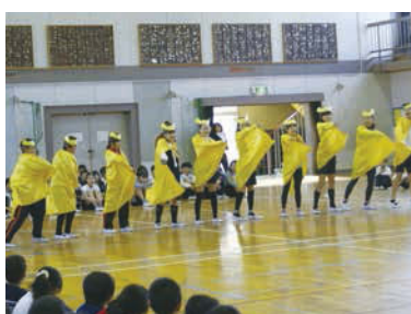
↑自作のコスチュームでみんなを笑顔に!今年度で3代目のこにここレンジャー。