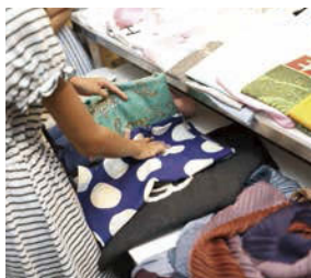
ストールは素材によって畳み方、並べ方の工夫が必要です。