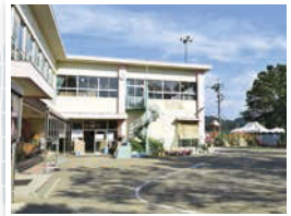
四季折々の草花に触れられる園庭。年長児中心に、野菜作りも体験。