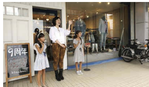
笑顔で見送りながらも、駐車場からお客さまが車を出される時に、歩行者や他の車が来ないか確認します。

体験中にちょうど、お客さまが帰られるので、お店の外へ出て一緒にお見送りしました。