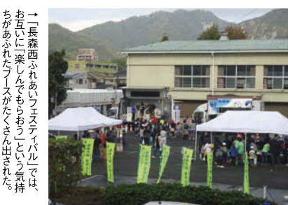
→「長森西ふれあいフェスティバル」では、お互いに「楽しんでもらおう」という気持ちがあふれたブースがたくさん出された。

また、長森西小学校には6年生がリーダーとなったたてわりの「なかよしグループ」があり、「なかよし活動」を行っています。仲間のことを考え、思い合っことができ、楽しく活動することができ、おり、あたたかい心の児童に成長していることが分かります。