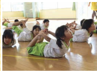
↑腹ばいになって腕を伸ばし、足指で床を蹴って前に進む、カメ体操。