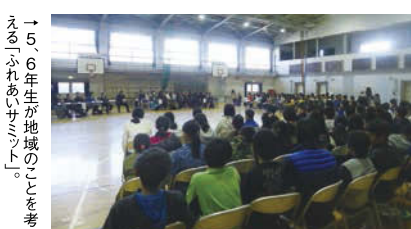
→5、6年生が地域のことを考える「ふれあいサミット」。