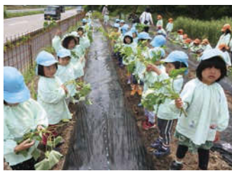
↑食育を通して様々な野菜作りや収穫を体験。秋にはさつまいも掘りをしたよ!