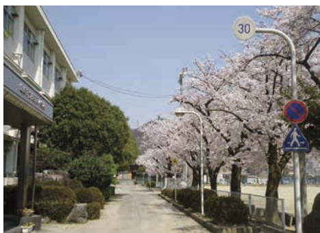
一地域と共に咲き続けている桜は長森西小学校の宝。