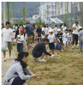
↑苗植えの作業では、地域の方とのふれあいの場にもなった。

地域の思いを引き継ぐ「桜プロジェクト」のほかに、地域と保護者の方々とともに夢を抱いて創造する学校へと歩む「夢プロジェクト」にも取り組んでいます。6月には校庭の芝生化として、地域の方と保護者200名ほどが集まり、児童とともに、苗植え作業を行いました。芝生には、運動や遊びの活性化、けが防止、熱中症対策、砂ほこり対策などさまざまなメリットがあります。「裸足で歩きたい」「桜が咲いたらお花見をしたい」など、児童からも、地域の方からも喜びの声が聞こえてきました。