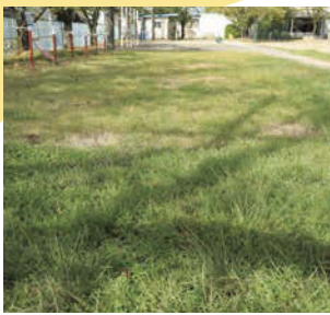
↑美しい芝生が育っている。