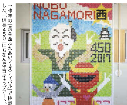
→昨年の「長森西ふれあいフェスティバル」で挑戦した「信長450」にちなんだエコキャップアート。