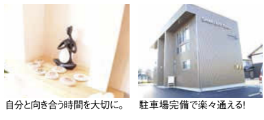
自分と向き合う時間を大切に。 駐車場完備で楽々通る!