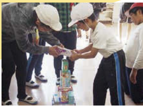
↑ たてわり集会の準備時間で、ゲームが楽しくできるかチェック中。

低学年の子は照れた表情も見せており、リーダーの6年生が仲間の様子をみながら、思いやりをもつて接していたとのこと。クラスとは異なるさまざまなお店屋さんごっこ、3択クイズを解いて校内をまわる「市橋ウォークラリー」を行いました。お店屋さんごっこでは各班が考えたゲームに挑戦し、折り