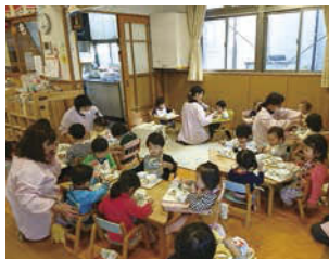
↑園内で作られるできたての給食。小さい子どももモリモリ食べます！