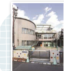
2階建ての園舎。駅近くという好立地ながらも、周りは住宅に囲まれた静かな環境。