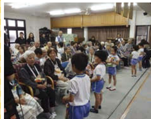
↑デイサービスルームへ訪問し、おじいちゃんおばあちゃんに歌や楽器演奏を届けました。

で、それを目標に、普段から歩くことを習慣づけていければと思います。また、昨年11月には初めての試みとして領下保育園まで徒歩で園外交流に出掛けました。これも歩く習慣づけの一環。向こうでは領下保育園の子ども達とゲームをしたり、持参したお弁当を食べたりと楽しいひと時を過ごしました。何か目的をつくってあげることで、楽しく運動する習慣をもってもらえれば。そして園生活を通して、将来の体制の基礎を作ってもらえればうれしいですね」と水上園長は話します。