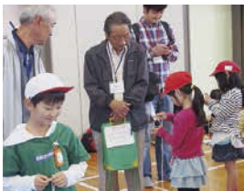
↑ たくさんの地域の方と交流ができた。