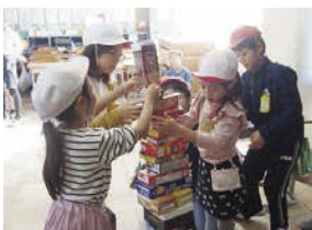
↑ お店屋さんごっこでは、みんな楽しくゲーム。

紙作品の景品をもらいます。工夫を凝らしたゲームやすてきな折り紙作品が用意され、たてわり活動の時間にみんなできっぴり準備できていることが分かります。