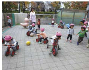
↑みんな大好きな園庭遊び！色々な年齢の子どもたちが一緒になって遊びます。