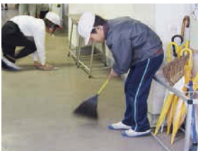
「毎日のそうじを「がんばる」児童。」

「か」は「考える」で、授業を大 市橋小学校では、子どもたちが輝いて生きぬくことを願い、「一人一人の「個」を大切にしながら、つながりをもって生きてほしいとの思いを込めた教育目標がたてられています。「かがやき 生きぬく」の「かがやき」は重点目標の頭文字になっています。