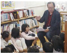
↑ 地域の方からお話を聞いた「コミスク市橋」。

3・4年生は「ほかほか言葉」がテーマでした。事前アンケートを行い、親子それぞれの立場で言われたら嬉しい言葉と嫌な言葉についてを考え、お互いの気持ちを考えることができました。5・6年生は「伝統〜これから市橋小のために私たちができ