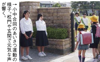
→小中合同のあいさつ運動の様子。校門や玄関で元気な声が響く。