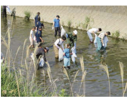
↑ 地域の伝統となっている論田川清掃。たくさんの人が集まる。

5年生は論田川をはじめ、地域の環境について学びます。本来の論田川の姿がいつまでも続いていくことに期待ができます。