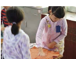
↑ かがやきトークで、お手伝いのコツを教えてもらった。

ること」をテーマに、伝統を高める、引き継ぐことについて考える、どんな姿を大切にしていこうべきなのかを考えました。