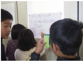
↑ 校内をまわりながらクイズラリー。学校のことを深く知ることができるクイズだった。