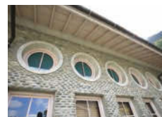
水の体験学習館(旧ポンプ室)。

場所／岐阜市鏡岩408-2 開館時間／9:30～16:00 休館日／月曜日(祝日の場合は翌日)、年末年始 入場料／無料(自由見学)