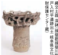
縄文土器 深鉢形土器 土偶 岐阜県文化財 財保護センター蔵

◆場所/岐阜市歴史博物館(岐阜市大宮町2-18-1) ◆観覧料/高校生以上300円(240円)、小中学生150円(90円)※( )は20人以上の団体料金。※各種障害者手帳をお持ちの人とその介護者1人・岐阜市内在住の70歳以上の人は証明書などを提示すると無料。岐阜市内の中学生以下の人は無料。家庭の日(8月18日(日)・9月15日(日))に入館する中学生以下の人とその家族は無料。◆休館日/8月5日(月)・19日(月)・26日(月)・9月2日(月)・9日(月)・17日(火) ◆問合せ/岐阜市歴史博物館 TEL.058-265-0010