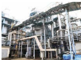
脱水した汚泥を焼却する「焼却設備」。

下水管を通して運ばれた汚水は「スクリーン」、「沈砂池」、「最初沈でん池」、「生物反応槽」、「最終沈でん池」、「塩素混和池」などを通過しながらきれいな水へと処理されています。北部プラントでは、汚水から取り除いた汚泥を濃縮・脱水してから焼却をしています。焼却後の灰から「りん」を回収し、肥料として再資源化しています。