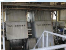
汚水中の大きなごみを取り除く「スクリーン」。