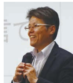
岐阜大学 高木朗義 教授