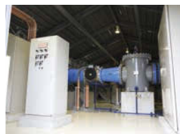
紫外線処理装置。万が一、塩素殺菌だけでは消毒が困難な病原生物がいた場合に備えて、紫外線照射している。

昭和5年に通水した、岐阜市で最も古く、最も規模が大きい水源地です。長良川の伏流水をポンプで取水し、消毒、紫外線処理をした水を各家庭等に配水しています。直径30m、高さ30mの配水池（水を一時的に貯めておくための施設）は金華山の地中に設置されています。景観や自然への影響を少なくしているほか、岩盤に囲まれているため、地震にも強いのが特徴です。