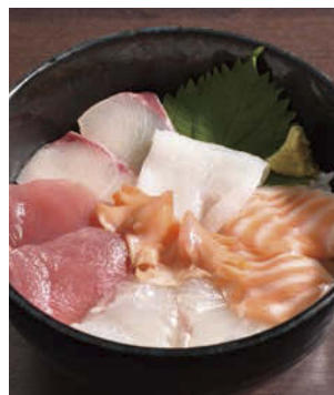
丼のご飯大盛りは+100円!

Price (税抜) ・特上ランチ丼 1,500円 ・白身三味丼 1,280円 ・炙り三味丼 1,380円 ・貝づくし丼 1,280円