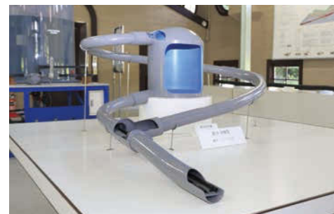
職員手作りの鏡岩配水池の施設模型。