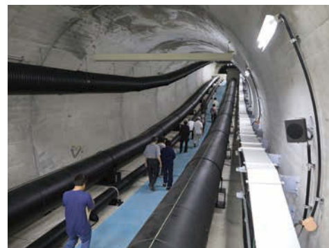
配水池へと続く巨大なトンネル。

昭和5年に通水した、岐阜市で最も古く、最も規模が大きい水源地です。長良川の伏流水をポンプで取水し、消毒、紫外線処理をした水を各家庭等に配水しています。直径30m、高さ30mの配水池（水を一時的に貯めておくための施設）は金華山の地中に設置されています。景観や自然への影響を少なくしているほか、岩盤に囲まれているため、地震にも強いのが特徴です。