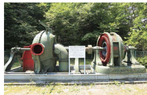
資料館の周囲にある展示物にも注目。

場所／岐阜市鏡岩408-2 開館時間／9:30～16:00 休館日／月曜日(祝日の場合は翌日)、年末年始 入場料／無料(自由見学)