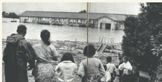
台風で浸水した小学校(養老町)