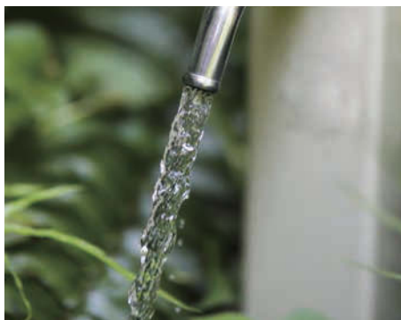
昭和60年に、旧厚生省から「水道水のおいしい都市」に選定された。

ますが、これらの施設は全て上下水道事業部で集中監視をしているため、安全に水を届けることができます。また、使用した水（いわゆる汚水）と雨水を合わせて下水と言いつ、街の清潔さ、環境安全を守るために、適切に処理がされています。