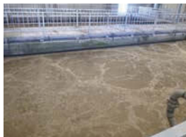
「生物反応槽」では、汚れを沈みやすくする処理が行われている。