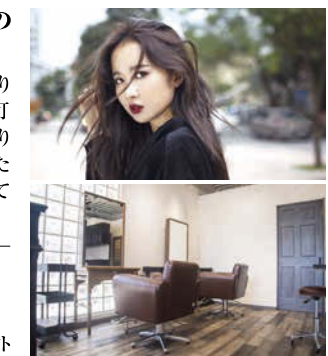
新鮮で有益な情報を届け続けます。

Recommend オススメ 「髪」から生まれる願いを叶え悩み解決へ アミノ酸とコラーゲンを配合した、仕上がりに潤いツヤを与える拘りの「サブリカラー」で髪に負担なく髪本来の美しさを引き出します。トリートメントで潤い、質感UP!髪質改善へ導きます。