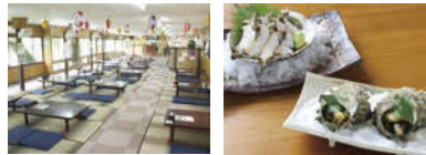
大人数も収容可。 鮎やサザエも。

上長瀬やなが、6月30日リニューアルオープン。本当に美味しい鮎を味わってもらうため、水槽から揚げたての活鮎を調理。仕入によって、やなでは珍しい海の幸が味わえることも。