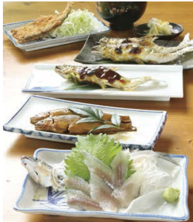
鮎の地方発送も。詳しくはお問い合わせください。

Recommend オススメ おトクに頂く絶品鮎づくし! 鮎フルコース (Aコース) 3,000円 (税抜) *鮎甘露煮2尾 *活鮎刺身1尾 *活鮎フライ1尾 *活鮎塩焼き2尾 *活鮎田楽1尾 *和亭鮎茶漬 Bコース…………… 4,000円 (税抜) *Aコースに+鮎南蛮漬け、天ぷら Cコース…………… 4,500円 (税抜) *Bコースに+鮎茶漬けの代わりに鮎釜飯