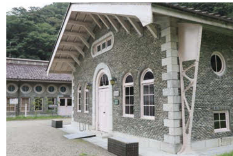
水の資料館(旧エンジン室)と隣接する水の体験学習館(旧ポンプ室)は国の登録有形文化財に登録されている。

鏡岩水源地に隣接した場所に、岐阜市が給水を開始した昭和5年から昭和40年代まで、エンジン室として使用した建物があります。現在、「水の資料館」として生まれ変わり、水道の歴史をふりかえるコーナー、ポンプ・流量計などの機器類コーナーなどがあり、岐阜市の水道への関心と理解を深めることができます。