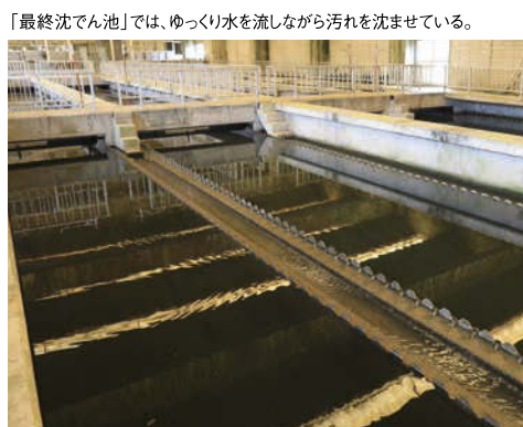
「最終沈でん池」では、ゆっくり水を流しながら汚れを沈ませている。

下水管を通して運ばれた汚水は「スクリーン」、「沈砂池」、「最初沈でん池」、「生物反応槽」、「最終沈でん池」、「塩素混和池」などを通過しながらきれいな水へと処理されています。北部プラントでは、汚水から取り除いた汚泥を濃縮・脱水してから焼却をしています。焼却後の灰から「りん」を回収し、肥料として再資源化しています。