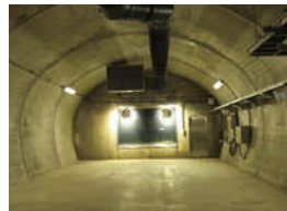
トンネル奥の配水池上部。窓の向こうに配水池がある。