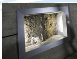
トンネル内には金華山の地下の様子を見ることができる部分もある。