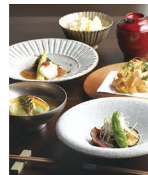
見た目も美しい、旬食材を使用したランチ。

☎058-325-9778 岐阜市柳津町丸野5-23 11:30~14:00 17:30~22:00 (LO.20:30) 火曜 共有15 26