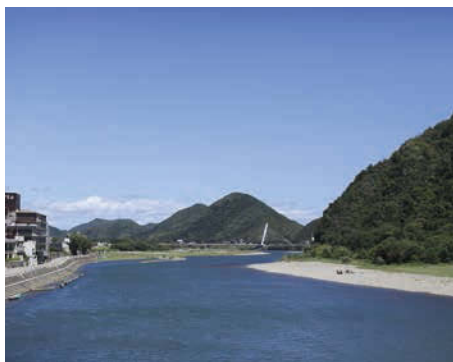
主な水源となる長良川は環境省の名水百選に選ばれている。