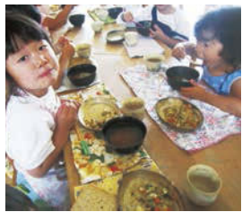
↑安心安全にこだわって作られたおひるごはんは、素材を活かしたやさしい味わい。