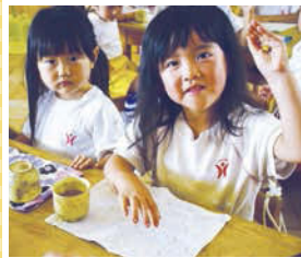
↑子どもたちが楽しみにしているおやつ時間ももちろん無添加で手作りしています。