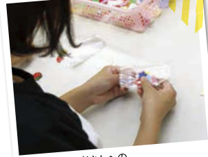
ワッペン購入者さんへのプレゼントづくりもしています。