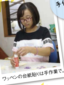
ワッペンの台紙貼りは手作業で。