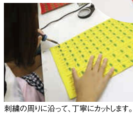
刺繍の周りに沿って、丁寧にカットします。