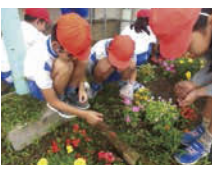
↑花壇への花植えの様子