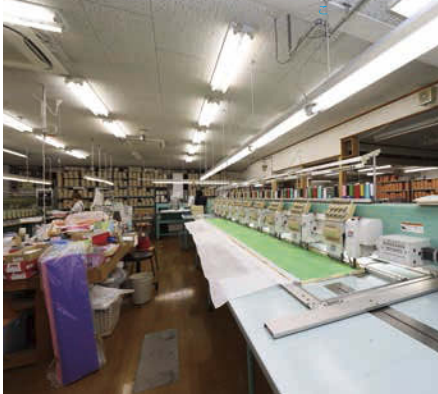
糸のセットやメンテナンスに時間がかかるため、スタッフが側について様子をチェックしています。