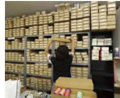
糸が入った箱についている番号順に返却。大量なので、探すのもひと苦労。