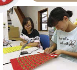
上手に切り取ることができた!