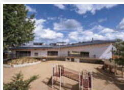
岐阜県産のひのきを使用した新園舎。