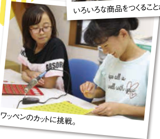
ワッペンのカットに挑戦。