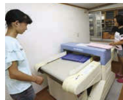
刺繍された布を検針機に通して、針の先などが混入していないかチェックします。