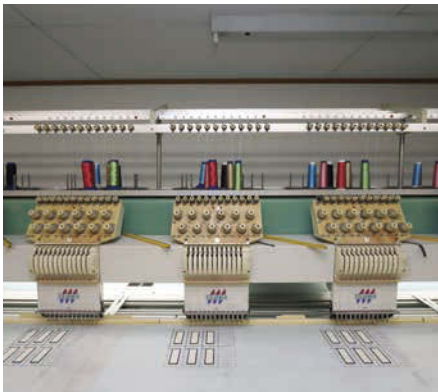
糸の色の数によっても機械を使い分けています。