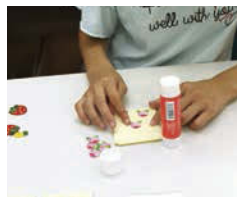
完成したワッペンを台紙に貼って商品に。かわいく、使いたくなるような貼り方がポイント!