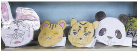
↑児童会の委員は手作りお面で動物になりきる。