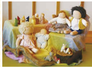
↑園で使用するおもちゃは、すべて自然素材で作られたもの。その多くは先生方による手作り。

縦割り保育で過ごす中で、年少児は年長児を見て学び、年長児は年少児を思いやるというきょうだいのような姿勢が自然と身に付き、子ども達は互いに助け合いながら生活するようになります。自ら成長できるような環境も、生きる根っこを育むには大切なことです。 「情報社会の現代で、正しい情報を選ぶことは難しいことです。しかし、子育てで真っ最中の方々には、本当に正しい情報を選択し、子どもたちの将来のための、今を生活に取り入れて頂きたいですね。御神木のいちじょうの木に守られているこども園に足を運んでみてください。うさぎも待つてるよ。」