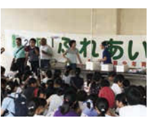
↑ふれあい広場の様子