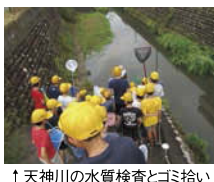
↑天神川の水質検査とゴミ拾い

SDGsを取り入れながら地域の中での様々な学びをきっかけに、自分たちがくらしている地域で何が起きているのか、将来どんな地域にしていきたいのか、夢の実現に向けて今自分たちは何ができるのか、自分自身に問いかけながら未来をみつめて取り組んでいます。