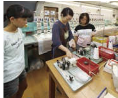
ホビンに糸を巻き、下糸の準備をします。専用機械で糸を巻くためのセッティングをします。