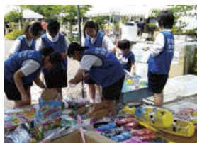
↑体育振興会フェスティバルで、模擬店ブースのお手伝い。