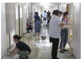
↑夏休みはPTAの方々と先生たちが協力して校内のペンキ塗りを実行した。