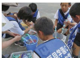
↑厚見地区夏祭盆踊り大会で夜店の準備。