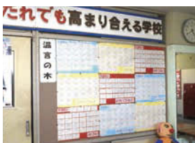
↑学年を越えて、生徒から生徒へ温かい気持ちを伝える「温言の木」。