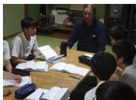
↑海の体験学習で職業について学んだ2年生。

から金華山を登り、長良川側に入り、鏡岩水源地で水について学びました。そのほか、年間を通して、岐阜市環境部の協力を得て、「ゴミや地球温暖化について学びます」。