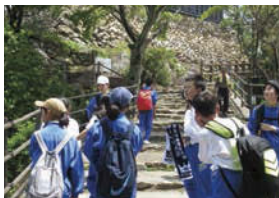
↑山と水について学んだ1年生の「金華山アタック」。