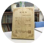
↑「ぎふエコチャレンジエコスクールレポート」において様々な取り組みをしていることを認められた。