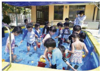
↑プールにたくさんのおもちゃを浮かべて、思い思いに水遊び!