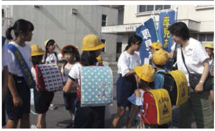
厚見小学校で小中合同のあいさつ運動。

厚見中学校区にある小学校は厚見小学校1校のみ。小・中という特色を生かし、小・中一貫校の「厚見学園」を立ち上げ、児童生徒を9年間通した教育で育てています。 昨年度より、小学校と中学校の教育目標も統一し、学園の体制作りや指導内容、取組の期間（タイム制）も整理しています。 日頃から小学校、中学校で連携をとっているのはもちろん