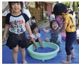
↑赤・青・黄色の色水で遊ぶ2歳児クラスの子どもたち。冷たくてカラフルな水におおはしゃぎ♪