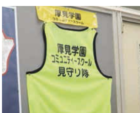
↑生徒はピブスをつけ、自覚や責任感をもってボランティア参加している。

こうした双方方向の活動によって、地域の方々にも学校のことを知っていただけると同時に、子ども達も豊かな学びができるという、まさに「コミュニティ」の魅力を大いに活かしています。