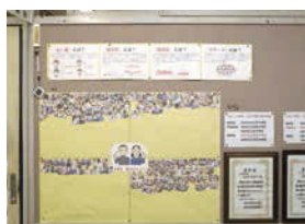
↑岐阜市の歯の優良学校として平成29年度、平成30年度に表彰を受けている。