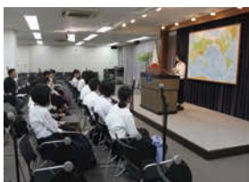
東京での修学旅行で人権学習を行った3年生。