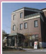
茶色レンガの5F建てビルが目印です!

水曜 平日/11:00~20:00 定休 土日祝/10:00~20:00 ※19:00最終受付