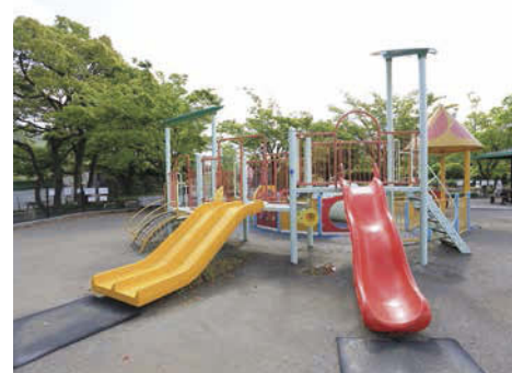
幼児専用のアスレチック遊具。