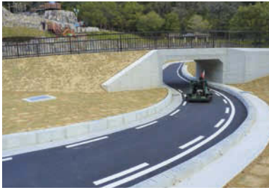
コース長350mの「ゴーカー」(有料)。