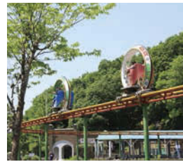
サイクルモノレールも楽しめる(有料)。