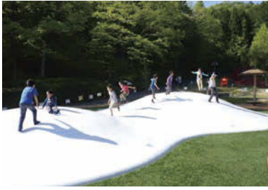
びよんびよん跳ねる「ふわふわドーム」。