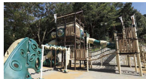
物見やぐらやロングスライダー、うずまきスライダーで遊ぼう。

金華山の麓、岐阜公園内にある「ちびっこ天下広場」は自然に囲まれた場所で、まるで戦国時代にタイムスリップしたかのような感覚で遊べるエリア。幼児用と児童用のゾーンに分かれているので、安全に遊ぶことができます。幼児用にはかやぶき風の屋根のついた複合遊具が、児童用には地上約3mから見渡せる物見やぐらがある。戦国時代の砦をイメージした複合遊具があります。