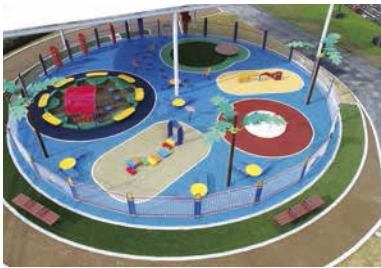
3歳未満児専用の「すくすくランド」。