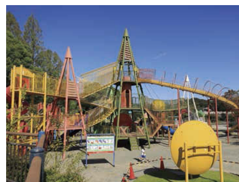
アスレチック遊具の四本の主塔は、長良公園のシンボルとなっているメタセコイアの木の四季をイメージ。