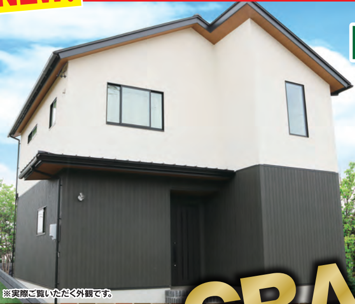
※実際ご覧いただく外観です。