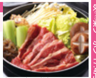
本物の味をお値打ちに。