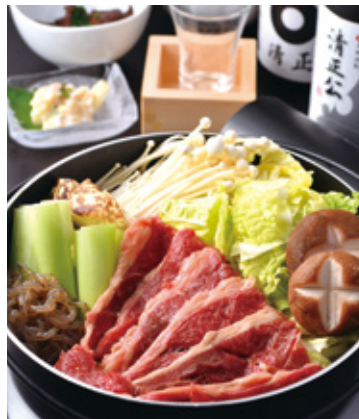
口の中で溶けてしまう質な脂を満喫して下さい。