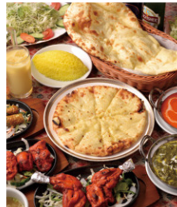
お得なセットメニューが充実。