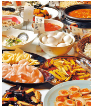
↑ 既存のディナーメニューは変わらず対応します