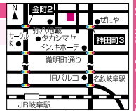
タカシマヤより徒歩で約5分