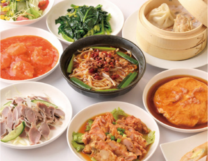
百味軒の自慢の料理がお得に味わえるスペシャルセットをご用意!

*ランチ・ディナー共にOK! *野菜サラダ *パリパリ春巻き *飲茶セット *選べる主菜2品(下記より) 【海老チリソース/青根肉絲/エビマヨ/麻婆豆腐/酢豚/かに玉/イカのヒリ辛炒め/油淋鶏】 *ミニラーメンorライス *杏仁豆腐orソフトドリンク