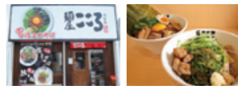
大きな看板が目印です。 トッピングでさらに美味!

モチモチ極太麺と自家製台湾ミンチを豪快 に混ぜて食べる台湾まぜそばは一度食べた らヤミツキになる旨さ!辛さが苦手な人でも平気 な商品もあります!是非一度ご賞味あれ!