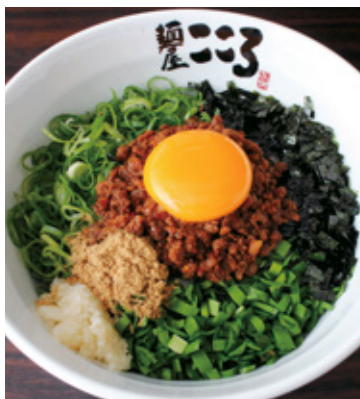
この辛さと旨さにハマる人続出中!