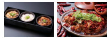
とんちゃん3種盛り。 激辛とんちゃんイメージ。

七輪を囲み、どこか懐かしい昭和の雰囲気 に浸りながら仲間とワイワイ盛り上がるのが石 川流。名物「とんちゃん」は280円。コース料理 も1,500円からとリーズナブル。