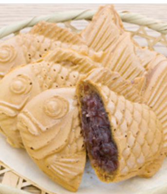
水分の量まで計算された生地は、カリッと、モチっとした食感!