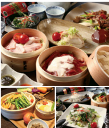
右下)時菜滑魚(鮮魚のカルパッチョサラダ風)1,000円

点心・蒸籠・広東料理が味わえる スペシャルコース 自慢の蒸し料理が お手軽に味わえる蒸籠コース...2,000円(税込) 食材にこだわった厳選食材の 中華蒸籠スペシャルコース...3,000円(税込) 各コース+100円でドリンクバー追加可能