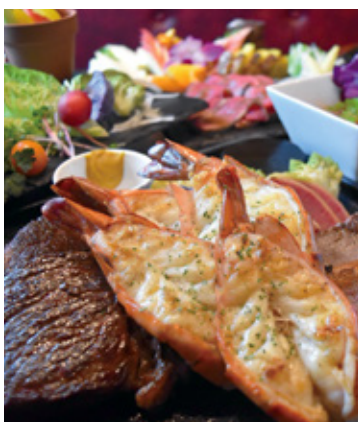
上質なお肉が食べられる飲み放題付きコース。

*自家製ピクルス *季節野菜のバーニャカウダー * ガッテンダーフライドポテト *テンダーリンスステーキ * サーロインステーキ *フィレステーキ *特大エビの 鉄板焼き *ガーリックライス *デザート盛り合わせ (LO.30分前) ※他にも3,000円と5,000円のコースも御座います。 予算に応じてコースをご用意致します。