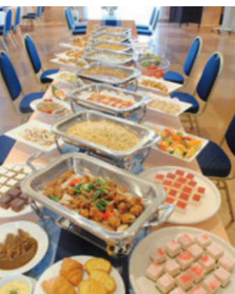
常時約40種類の料理、デザートが並ぶ豪華メニュー!

*歓迎宴会 *謝恩会 *同窓会 *結婚式の二次会 *懇親会 *会議 *記念パーティ等 15名から最大200名まで承ります。 お気軽にご相談お待ちしております!