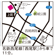
名鉄西尾線「西尾駅」から車で11分。