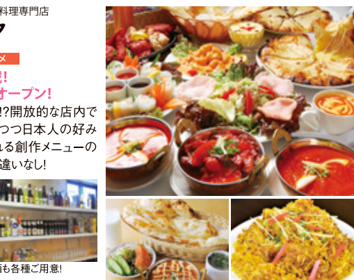
ランチタイムはナン・ライスおかわり自由!

お店の味をお持ち帰り頂けます! テイクアウト用お弁当(カレーとナンのセット)500円〜 1/2(火)よりテイクアウト商品半額キャンペーン開催! 毎月第1・3火曜日は テイクアウトカレーが..... ALL50%OFF! ※1月のみ第1火曜日