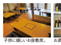
子供に嬉しいお座敷席。 お酒も各種ご用意!

オリジナルメニュー満載! スパイス薫る本格店がオープン! 気分はまるでインド旅行!?開放的な店内で味わう、本場の味を生かす日本人の好みにアレンジされた個性溢れる創作メニューの数々にヤミツキになる間違いなし!