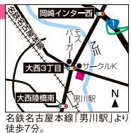
名鉄名古屋本線「男川駅」より徒歩7分。