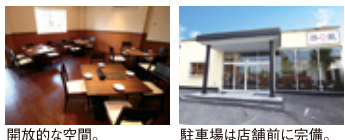
開放的な空間。 駐車場は店舗前に完備。

食材本来の旨さを最大限に引き出す答えが「蒸籠」。多彩な蒸し料理と広東料理を スタイリッシュな中華ダイニングで。早朝に魚市場で 直接買い付ける新鮮な海鮮料理もお値打ちに 提供してくれる。