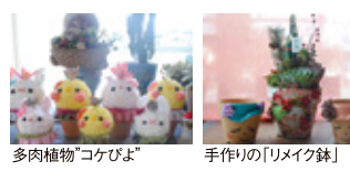
多肉植物「コケびよ」 手作りの「リメイク鉢」

岡崎市にみどりと雑貨のお店がOPEN! 贈り物なら『GREEN RABBIT』へ♪ 植物の卸売りをメインに行う会社なので鮮度の良い植物がたくさん揃っています。新商品が常に並ぶため何度来ても楽しいお店に。インテリア雑貨や季節のグッズも◎