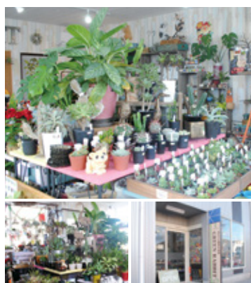
たくさんの緑に囲まれゆっくりとご覧ください♪

Recommend オススメ 組み合わせを楽しんで選べる! ミニ多肉(1号)..... 130円 アニマルミニ鉢 280円〜 人気のアニマルミニ鉢!お部屋のちょっとしたインテリアも◎