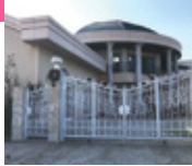
ブランポルテ外観

*コピー可 *1組1組全員使用可 *他券・他サービス併用不可 ブランポルテ ☎070-5020-1009