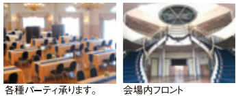
各種パーティ承ります。 会場内フロント

ホテルで腕をふるってきたシェフたちの逸品を 広々とした館内でバイキング方式に時間無制限 なのでランチ後のデザートやティータイムまで ごゆっくりお楽しみいただけます。