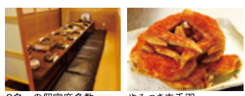
2名~の個室席多数。 やみつき赤手羽。

熊本産馬刺し、宮崎産鶏の赤手羽、チキン南蛮、もつ鍋、西郷どんブームで一躍注目を浴びている鶏飯などの九州料理を食したいならココ。ご当地の新鮮食材を使った本場の味。