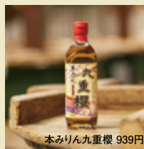
本みりん九重櫻 939円

[営業時間] 9:30-17:30 [定休日] 月曜 [TEL] 0566-45-7998