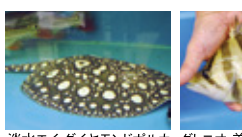
淡水エイ ダイヤモンドボルカ ダトニオ 美バンド

熱帯魚の中でも大型魚を専門として取扱い、アロワナ、淡水エイ、キクラ類などの定番魚多数を幼魚から大型まで取り揃えております。不要魚や不用水槽の引取・買取サービスも!