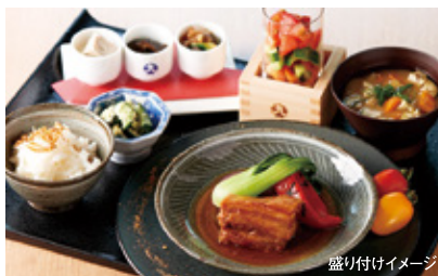
盛り付けイメージ