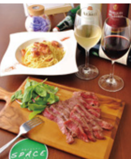
ワインとお肉でチョット贅沢なひと時を。