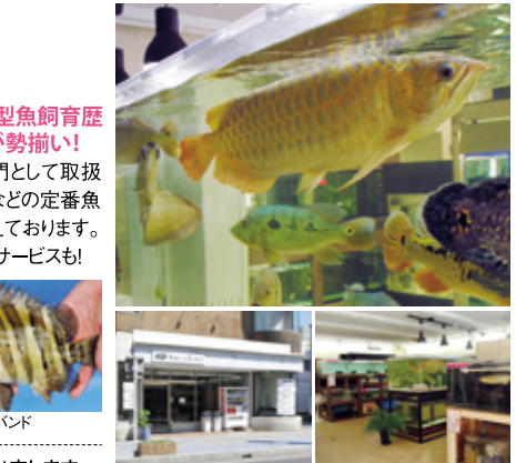
アロワナ等が多数いる店内中央の大型水槽は迫力満点!