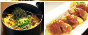
左)鶏飯 右)馬刺しとアボカドのカルパッチョ