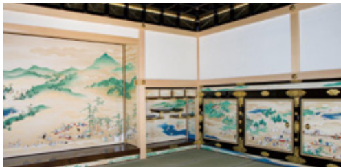
対面所上段之間

オープニングセレモニー 日時……6/1(水)9時15分～ 場所……本丸御殿 車寄前