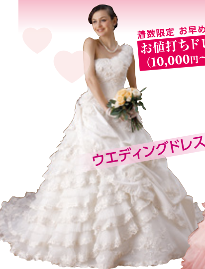
ウエディングドレス