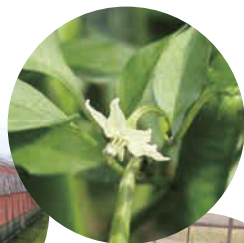
甘長ピーマンの花。小さくかわいらしい。