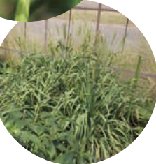
ハウス内には防除用に小麦が植えられている。

試験用ハウス。赤いネットは防虫用。紫外線を頼りに移動する虫の性質を利用し、紫外線カット加工がしてある。