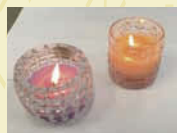
アロマキャンドル