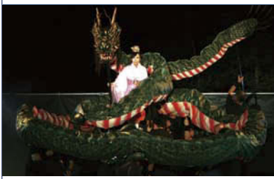
1 創作音楽劇「夜叉ヶ池物語」上演の様子