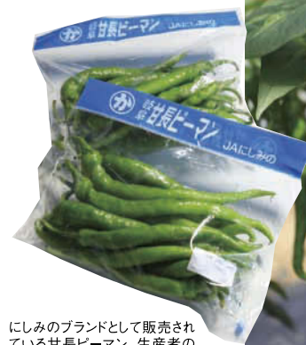
にしみのブランドとして販売され ている甘長ピーマン。生産者の 名前が記されている。出荷先は 地元のほか、大阪・中京市場に も出回る。