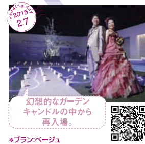
幻想的なガーデン キャンドルの中から 再入場。 *プラン・ページョ