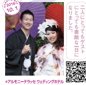
二人にとってもゲスト にとっても素敵な一日に なりました。 *アルモニーテラス ウェディングホテル