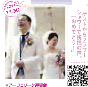
ゲストから「ラララ」 「おめでとー!」 シヤワーで祝福の声。 *アーフェリーク迎賓館