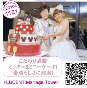
こだわり満載 ミッキー&ミニケーキ! 素晴らしいに感激! *LUCENT Marriage Tower