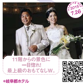
11階からの景色に 一目惚れ! 最上級のおもてなしW。 *岐阜都ホテル