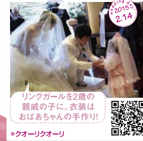
リングガールを2歳の 親戚の子に。衣装は おばあちゃんの手作り! *クオーリクオーリ