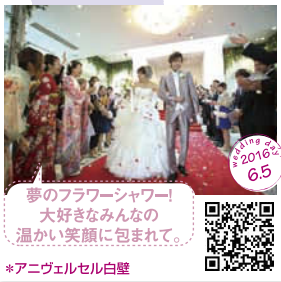
夢のフラワーシャワー! 大好きなみんなの 温かい笑顔に包まれて。 *アニヴェルセル白壁

2人のセレモニーフォト&レビューを大公開! 人生最大のしあわせ写真をご紹介します。