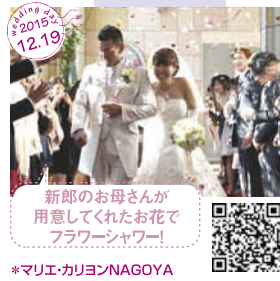
新郎のお母さんが 用意してくれたお花で フラワーシャワー! *マリエ・カリヨンNAGOYA