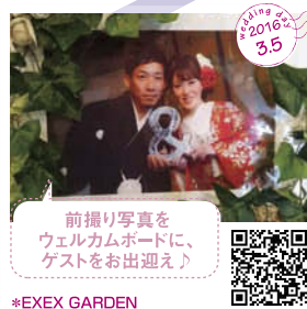
前撮り写真を ウェルカムボードに、 ゲストをお出迎え♪ *EXEX GARDEN