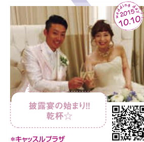
披露宴の始まり!! 乾杯☆ *キャスルプラザ