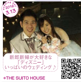
新郎新婦が大好きな 「ディズニー」 いっぱいのウェディング♪ *THE SUITO HOUSE