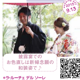
披露宴での お色直しは新婦念願の 和装姿♪ *ラルー・チェ デル ソーレ