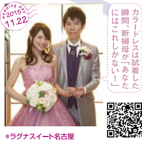
カラートレズは試着した 瞬間「新婦母が「あなた にはこれしかない!」 *ラグナスイート名古屋