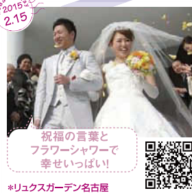
祝福の言葉と フラワーシャワーで 幸せいっぱい! *リュクスガーデン名古屋