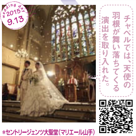
チャペルでは、天使の 羽根が舞い落ちてくる 演出を取り入れた。 *セントジェーン大聖堂(マリエール山手)