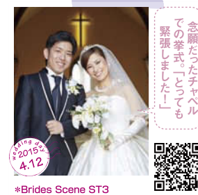
念願だったチャペル での挙式「とっても 緊張しました!」 *Brides Scene ST3