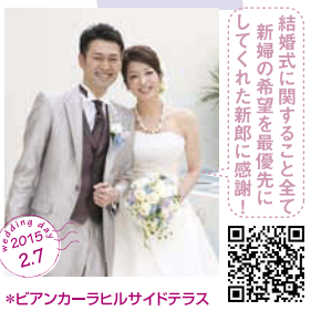
結婚式に関する全て 新婦の希望を最優先に してくれた新郎に感謝! *ピアンカーラヒルサイドテラス