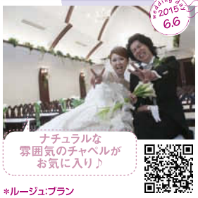
ナチュラルな 雰囲気のチャペルが お気に入り♪ *ルージュ・プラン