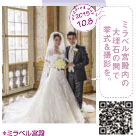
ミラベル宮殿内の 大理石の間で 挙式&撮影を。 *ミラベル宮殿