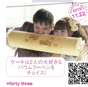
ケーキは2人の大好きな パウムクーヘンを チョイス! *forty three