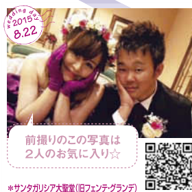
前撮りのこの写真は 2人のお気に入り☆ *サンタカリア大聖堂(旧ファンテグランテ)