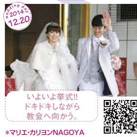
いよいよ挙式!! ドキドキしながら 教会へ向かう。 *マリエ・カリヨンNAGOYA