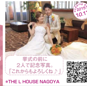
挙式の前に 2人で記念写真。 「これからよろしくね」 *THE L HOUSE NAGOYA