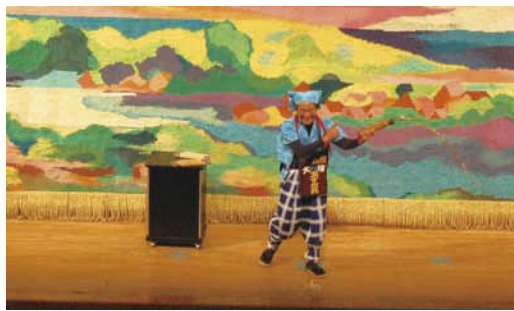
会場を楽しい雰囲気させた「南京玉すだれ」。