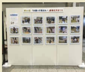
今年の新春正月まつりの様子を写した写真が飾られる。