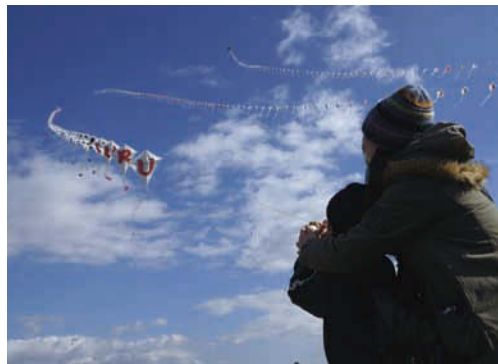
写真上／大垣市のマスコットキャラクター「おがっき」も連凧あげに挑戦。