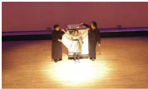
大きな箱から子どもが出現するマジック。