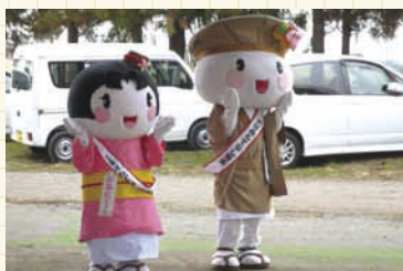
大垣市のマスコットキャラクター「おがっき」と「おあむちゃん」も応援に。