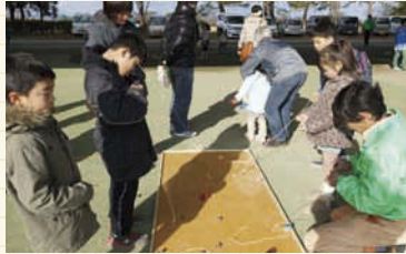
昔ながらのコマ回しに夢中。