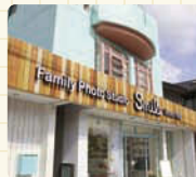
カラフルな看板が目印。