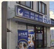
【久瀬川町3】の交差点を北にすぐ