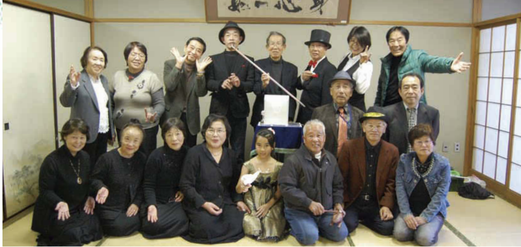
12月11日、大垣市ストピアセンターで「親子で手品・人形劇を楽しむ」に出演。楽屋にて全員集合!