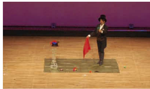
山高帽と燕尾服に身を包むマジシャン。