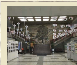
大垣市役所のロビー上部を飾る連風。