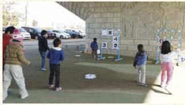
ストラックアウトを楽しむ子どもたち。