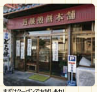
まずはクーポンでお試しあれ!