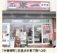
「中曽根町」交差点を車で西へ3分