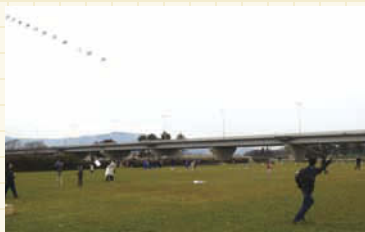
連風などをあげる子どもたち。

今年の新春正月まつりは1月21日(土)の開催。申し込み不要(当日会場受付)なので、思い立ったが吉日で、気軽に家族で出かけてみませんか。いつもとは違う雰囲気の中で、大人も子どもも思いつきり遊ぶことができるでしょう。