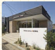
フォトエステも受付中!