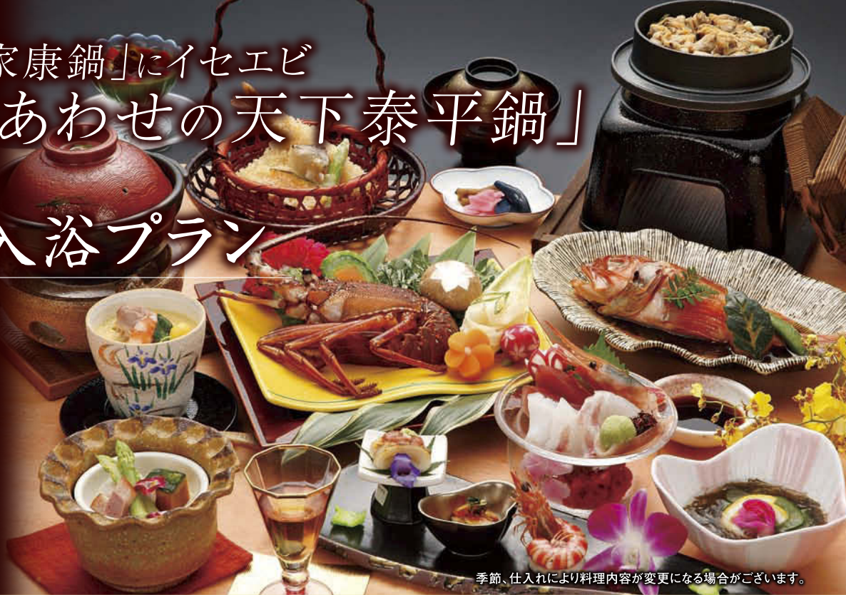
季節、仕入れにより料理内容が変更になる場合がございます。