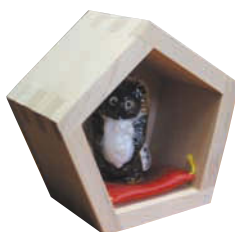
※タヌキの置物は付属しません

受験シーズンのお守りにしたい合格祈願枘。枘組みの高度な技術を駆使した五角形の枘で、「合格」と「五角」を掛けている。好みに「合格します」の焼印を入れることもできる。また、別途、目指す大学名なども入れることもできる。 2,160円