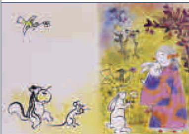
↑守屋多々志/絵本がくやひめ挿絵