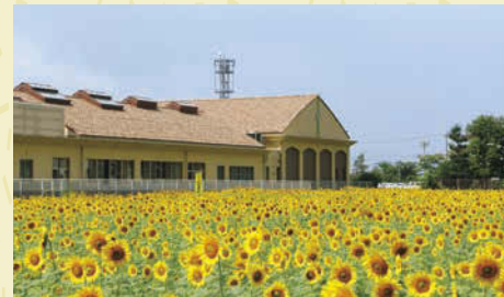
【墨俣町内】 面積:2.2ha 本数:約10万本