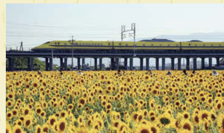
【平町内】 面積:2.2ha 本数:約10万本

大垣の夏の風物詩となっている休耕田を利用したひまわり畑。今年は、平宮農組合と農事組合法人墨俣の協力により、大垣市内2か所で黄金色に輝くひまわり畑を楽しむことができます。