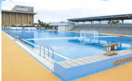
水球などの各種大会にも使用される本格派50mプール。9コースあり。