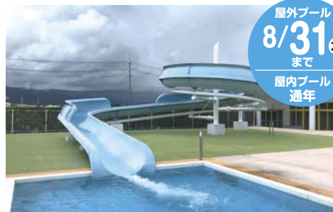
夏期限定のウォータースライダー。小学生以上、身長120cm以上が対象。