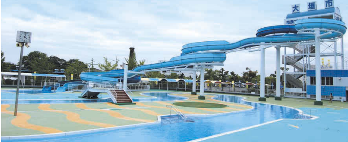
水深90cm、長さ145mの楽しい流水プールと、長さ124mの迫力満点のウォータースライダー。