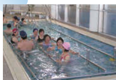
健康増進用歩行プール