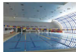
25mの遊泳用プール(温水)。8コースあり。スイミングスクールも開催。

一年中楽しめる室内温水プールがある海津の市民プール。屋外の子供・幼児用プールとウォータースライダーは夏休み期間限定で楽しむことができます。スイミングスクールやフィットネス教室も随時開催。