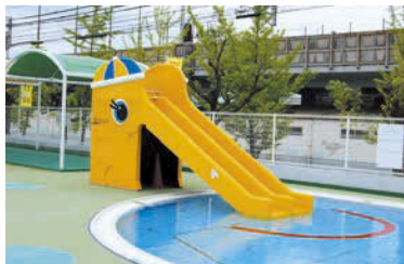
黄色のソウのすべり台が可愛い幼児用プール。水深40cm、広さ6×10m。