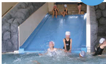
子どもたちが楽しむ幅広スライダー