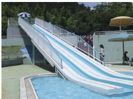
流水スライダーは直線で2コースあり。