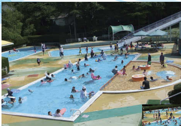
子どもゾーンには水深0.2m~1mの子どもプールのほか、水深0.4m~0.6mと水深0.3m~0.4mの2種類の幼児プールがあり、子どもの成長に合わせて楽しめる。