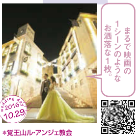
まるで映画の 1シーンのような お洒落な1枚。 *覚王山ル・アンジェ教会