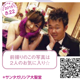
前撮りのこの写真は 2人のお気に入り☆ *サンタガリシア大聖堂