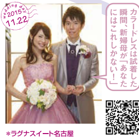
カラードレスは試着した 瞬間、新婦母が「あなた にはこれしかない!」 *ラグナスイート名古屋