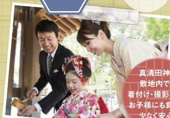
写真 ハツ切 [orハツ切]