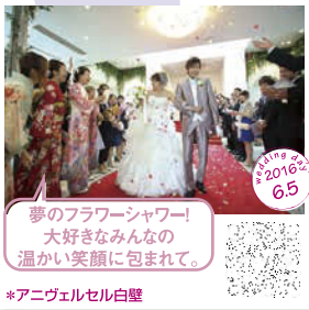
夢のフラワーシャワー! 大好きなみんなの 温かい笑顔に包まれて。 *アニヴェルセル白壁

2人のセレモニーフォト&レビューを大公開! 人生最大のしあわせ写真をご紹介します。