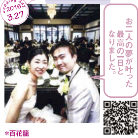
お二人の夢が叶った 最高の一日と なりました。 *百花籠