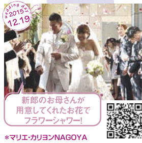
新郎のお母さんが 用意してくれたお花で フラワーシャワー! *マリエ・カリヨンNAGOYA