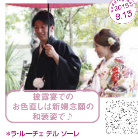
披露宴での お色直しは新婦念願の 和装姿♪ *ラルー・チェ デル ソーレ