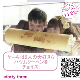
ケーキは2人の大好きな パウムクーヘンを チョイス! *forty three