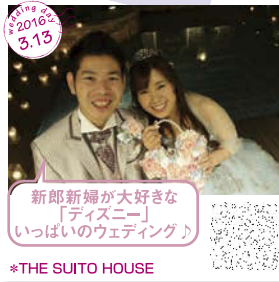
新郎新婦が大好きな 「ディズニー」 いっぱいのウェディング♪ *THE SUITO HOUSE