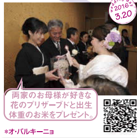
両家のお母様が好きな 花のプリザーブドと出生 体重のお米をプレゼント。 *オノビルキニーニョ