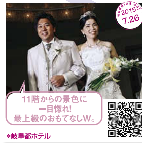
11階からの景色に 一目惚れ! 最上級のおもてなしW。 *岐阜都ホテル