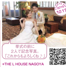
挙式の前に 2人で記念写真。 「これからもよろしくね♪」 *THE L HOUSE NAGOYA