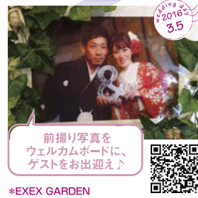
前撮り写真を ウェルカムボードに、 ゲストをお出迎え♪ *EXEX GARDEN