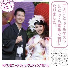
二人にとってもゲスト にとっても素敵な1日 になりました。 *アルモニテラッセ ウェディングホテル