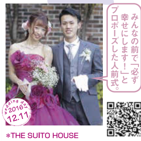
みんなの前で「必ず 幸せにします!」と プロポーズした人前式。 *THE SUITO HOUSE