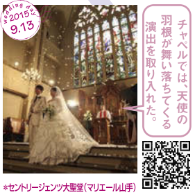
チャペルでは、天使の 羽根が舞い落ちてくる 演出を取り入れた。 *セントローレンツ大聖堂(マリエール山手)