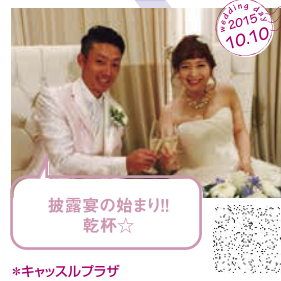
披露宴の始まり!! 乾杯☆ *キャスルプラザ