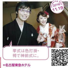
挙式は色打掛・袴で前式に。 *名古屋東急ホテル