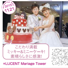
こだわり満載 ミッキー&ミニケーキ! 素晴らしいに感謝! *LUCENT Marriage Tower