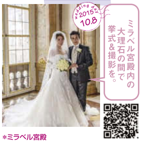
ミラベル宮殿内の 大理石の間で 挙式&撮影を。 *ミラベル宮殿