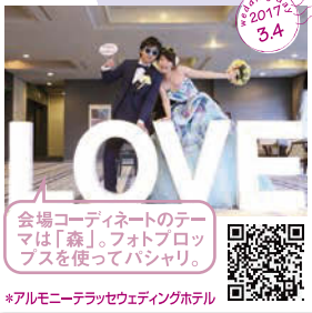
会場コーディネートの特 テマは「森」。フォトフロ ップを使ってパシャリ。 *アルモニテラッセウェディングホテル