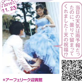
当日の天気は雨予報だっ たのに、曇りど留まっ てくれました!天の祝福! *アーフェリーク迎賓館