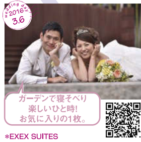
ガーデンで寝そべり 楽しいひと時! お気に入りの1枚。 *EXEX SUITES