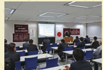
前回の講演会の様子