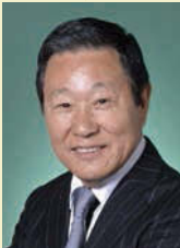
タレント なべ おさみ

大垣市は、タレントのなべおさみさんの講演会を開催します。なべさんには、人権とは同じ人間同士がお互い思いやりで生きることであると思いを、熱くお話しいたします。