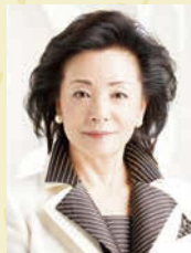
ジャーナリスト 櫻井 よしこ

大垣商工会議所は平成30年3月に創立125周年を迎えます。これを記念するとともに大垣市制100周年のイベントとして、国内外の経済に精通する著名な講師による講演会を開催します。