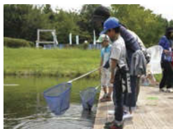
家族ではじめる生き物観察~水辺編~

水郷地域の特徴を生かし、園内には広大な池やクリクと呼ばれる水路が流れる緑豊かな公園。環境教育に関するイベントや、アートクラフト料理などの体験教室も土日を中心に随時開催中。ゴールデンウィークにはチューリップがテーマのイベントも開かれます。