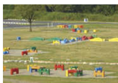
チビッコ広場・ピクニック広場

ひんやりした地下水のせせらぎで水遊び！ 木曾川と長良川の2つの大川を分流するために設けられた背割堤のすぐ端にある公園。地下水を水源にした水遊びが充実しているほか、延長約12kmの背割堤でのサイクリングもおすすめです。