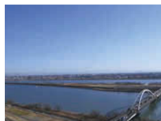
雄大な木曾三川が間近に迫る展望タワーからの眺め。

所/ 岐阜県海津市海津町油島255-3 開/ 9:30~17:00 ※イベントにより変更あり 休/ 第2月曜 料/ 入園無料 《緑の館・展望タワー》 大人620円、小中学生300円 交/ 養老鉄道「石津駅」より海津市コミュニティバス「木曾三川公園」下車 P/ 1231台(無料) 問/ Tel.0584-54-5531