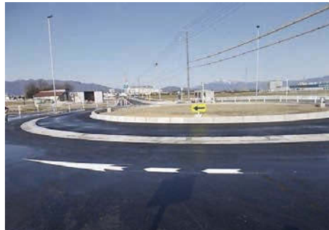
安八町に整備されたラウンドアバウト。