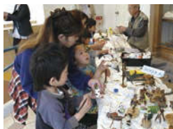
よのさんの木工教室

5月27日(日) 10:00~12:00 ※参加料100円 ※定員30人 ※事前予約制 網や仕掛けを使って水の中の生き物を観察しましょう。