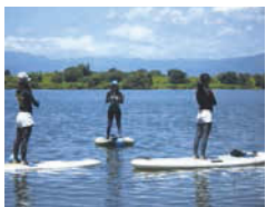
ウォータースポーツ

木曾川では、人気上昇中のSUP(サップ)やウインドサーフィンなどが一年を通して楽しめます。