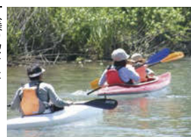
一人乗りカヌーと二人乗りカヌーの2種類あり。

爽やかな長良川でカヌー体験！ 長良川の自然に親しみ、水辺を利用したさまざまなスポーツやレクリエーションを楽しむことができます。これからの時期に一番のおすすめは川でのカヌー体験。基本的な操作は教えてもらえるので、初心者でも気軽にチャレンジできます。また、芝生広場でのニュースポーツも親子で楽しめるレクリエーションです。