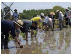
堀田で田植え体験

5月4日(金)・5日(土)・6日(日)・13日(日)・20日(日) ※参加料100円~ ※予約不要 木片や木の実などを利用して作品を作りましょう。