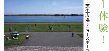
芝生広場でニュースポーツ

※遊具の貸出無料 ※貸出時間は1時間まで 芝生広場ではベタンク、RDチャレンジ、インディアカ、グラウンドゴルフなど、室内ではショートテニスやタスポニーなどのニュースポーツを楽しめます。