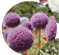
アリウムギガンテウム