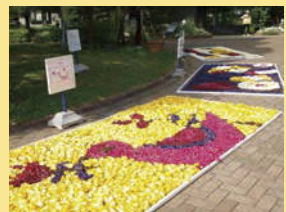
チューリップアート

■田舟にのろう 5月4日(金・祝)・5日(土・祝) 10:00~15:00 ※1人300円 ※定員100人 ※先着制