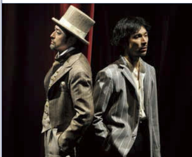
↑2013年舞台写真より