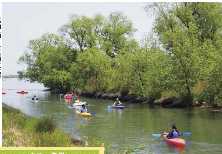
カヌーは中州に囲まれた浅瀬で体験。

所／海津市海津町福江字角山1202-2 開／センターハウス 9:30～17:30 休／第2月曜 ※休日の場合は翌平日 料／無料 ※イベントなどの参加費を除く 交／養老鉄道「石津駅」より海津市コミュニティバス「長良川サービスセンター」下車 P／90台(無料) 問／Tel.0584-54-2075