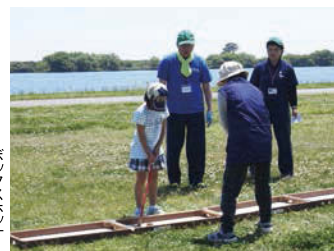
ボクシングゲーム

爽やかな長良川でカヌー体験！ 長良川の自然に親しみ、水辺を利用したさまざまなスポーツやレクリエーションを楽しむことができます。これからの時期に一番のおすすめは川でのカヌー体験。基本的な操作は教えてもらえるので、初心者でも気軽にチャレンジできます。また、芝生広場でのニュースポーツも親子で楽しめるレクリエーションです。