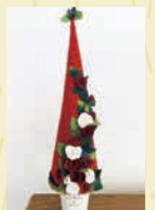
高さ約50cmのミニツリー。