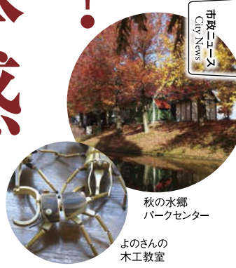
中継ニュース City News