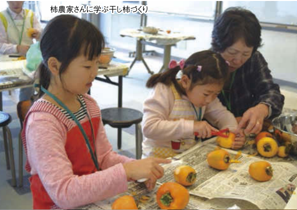
柿農家さんに学ぶ干し柿づくり