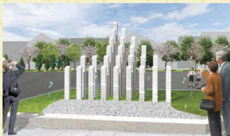
「天恩流行(てんおんりゅうこう)」