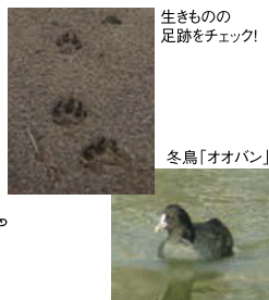
生きものの足跡をチェック!

フィールドサインを調べよう ～冬編～ ■とき／11月25日(日) 10:00～12:00 ■内容／園内にある足跡を観察して、どのような生きものが生息しているか調べましょう。 ■料金／100円 ■備考／要予約、定員30人