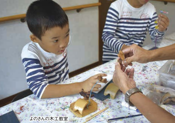
よさんの木工教室