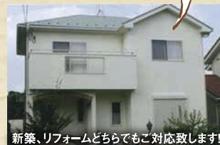
新築、リフォームどちらでもご対応致します!