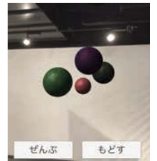
ARメロディボールのイメージ画面

IAMAS(情報科学芸術大学院大学)の学生が制作したアプリ「ARメロディボール」。iPadの画面に出現するボールが跳ねたり、複数のボールが床に衝突して音楽をつくる不思議なアプリを体験できます。