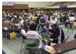
健康マージャン交流大会の様子

◆場所/総合体育館第1体育館(大垣市加賀野4-62)◆対象/岐阜県在住の人 ◆定員/200名(申込先着順)◆申込/9月27日(金)までに大垣市役所高齢福祉課で配布している申込書に必要事項を記入のうえ、ねんりんピック岐阜2020大垣市実行委員会(大垣市役所高齢福祉課内)へ提出を。※申込書は大垣市のホームページ内( http://www.city.ogaki.lg.jp/0000045954.html )からダウンロード可。 ◆問/ねんりんピック岐阜2020大垣市実行委員会(大垣市役所高齢福祉課内) TEL.0584-47-8839