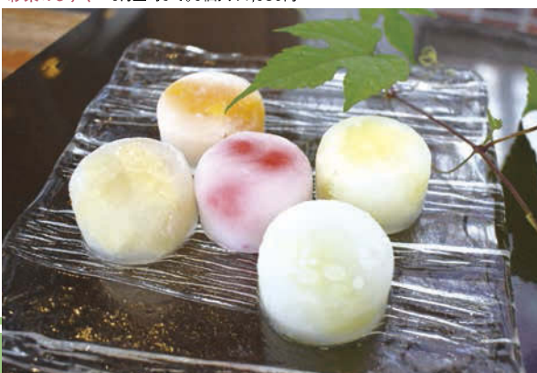
彩果のしずく 9月上旬まで。9個入り1,080円

水まんじゅう風の葛生地でフルーツのかたまりを包んだ「彩果(さいか)のしずく」は新感覚の水まんじゅう風スイーツ。面白いのは凍った状態で食べることで、餅アイスのような不思議な食感を楽しむことができます。フルーツは、みかん、キウイ、白桃、パイナップル、さくらんぼ、スイカ、ブルーベリー、メロンの9種類。