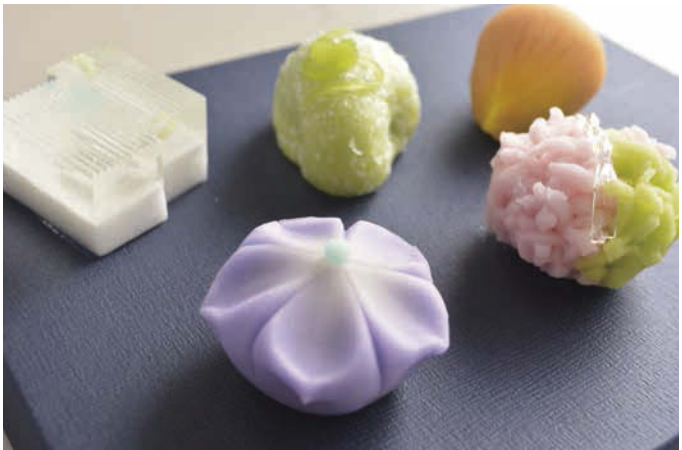
8月の上生菓子。手前から時計回りに「桔梗」「清流」「青瓢(あおぶくべ)」「鬼灯(ほおずき)」「撫子」。

水がおいしい城下町だった大垣は、昔ながらの菓子処です。現代人の嗜好に合った新しい素材や傾向にチャレンジしていきながらも、本物の素材を使って、丁寧な手仕事で生み出す“本物の和菓子”をこれからも作り続けていきたいと思っています。