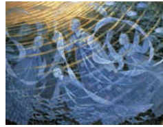
(水瀬)(守屋多々志、大垣市蔵)

◆場所/大垣市守屋多々志美術館(大垣市郭町2-12)◆入館料/大人300円、高校生以下無料 ◆休館日/火曜日、8月14日(水)、9月18日(水)◆問/大垣市守屋多々志美術館 TEL.0584-81-0801