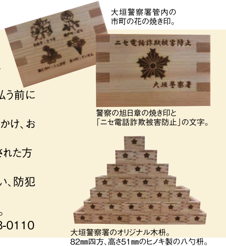
大垣警察署管内の市町の花の焼き印。