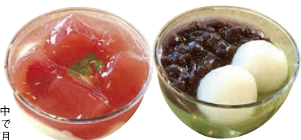
トマトとチーズの葛プリン

和菓子の素材や技術を使ってカップの中で完成させた和スイーツ。全約10種類で時期により店頭に出るものが異なる。7月中旬～9月下旬。1個230円