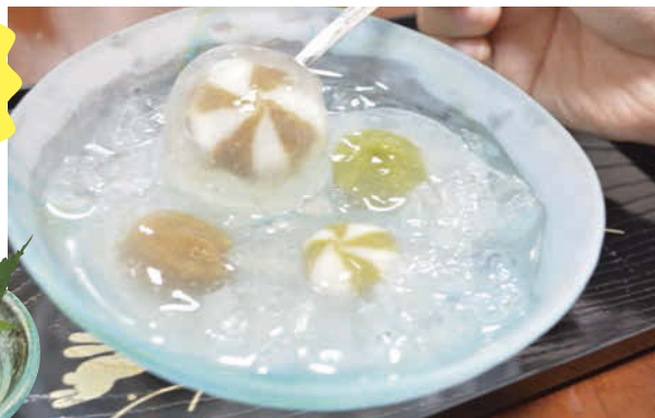
水まんじゅう ーほうじ茶あん・ほうじ茶ラテ・抹茶あん・抹茶ラテー 9月上旬まで。550円