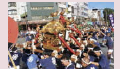
常葉神社神輿の渡御