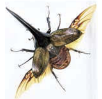
ヘルクレスオオカブト

◆場所/大垣市スイピアセンター学習会1階アートギャラリー(大垣市室本町5-51) ◆休館日/火曜 ◆料金/入場無料 ◆問/(公財)大垣市文化事業団Tel. 0584-84-2000