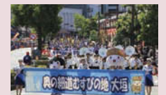
オープニングパレード