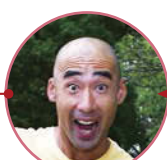
赤玉のマッスんさん ダンスパフォーマンス