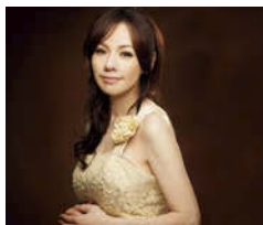
ソプラノ: 森 麻季

全国的に活躍しているトップレベルの室内オーケストラである「オーケストラ・アンサンブル金沢」(石川県)の音楽を楽しんでみませんか。[出演]独唱:森 麻季(ソプラノ)、指揮:ユベール・スダーン、オーケストラ・アンサンブル金沢