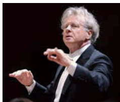
指揮: ユベール・スダーン

全国的に活躍しているトップレベルの室内オーケストラである「オーケストラ・アンサンブル金沢」(石川県)の音楽を楽しんでみませんか。[出演]独唱:森 麻季(ソプラノ)、指揮:ユベール・スダーン、オーケストラ・アンサンブル金沢