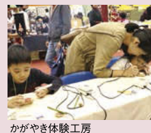
かがやき体験工房

親子でグラウンドゴルフ体験、家族写真で缶バッジづくり、ゆるキャラスタンブラリー、フリーマーケットなど。また、ぬり絵(大垣市HPからダウンロード)持参の子どもは、サイコロゲームに挑戦できます。