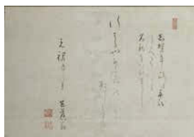
芭蕉筆「行はるや」発句懐紙(個人蔵)

芭蕉が自身の考えを述べた手紙や、発句を記した懐紙などの真筆作品を紹介しながら、俳諧の新風を模索し続けた芭蕉晩年の境地についてとります。3/29(日)、4/12(日)・26日(日)、5/3(日)・10日(日)には学芸員による企画展示解説「ギャラリートーク」を開催。開始時間はいずれも11時～と14時～で、各30分程度です。