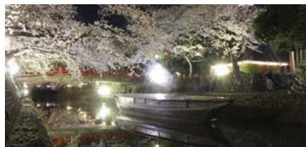
桜のライトアップ