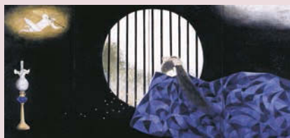
《みだれ髪(与謝野晶子)》(守屋多々志・大垣市蔵) 明治の歌人・与謝野晶子の少女時代をテーマに描いた作品。

◆場所／大垣市守屋多々志美術館(大垣市郭町2-12) ◆休館日／火曜(3/31、4/7、5/5は開館)、3/23(月)、4/30(木)、5/7(木) ◆料金／一般300円、18歳未満無料、大垣市内在住65歳以上無料 ※4/5(日)は春の芭蕉祭協賛による無料開放 ◆問／Tel.0584-81-0801