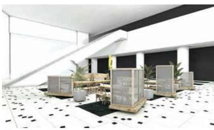
リニューアルしたふれあい広場。(画像はイメージです)

◆問/ソフトピアジャパンセンター指定管理者 (伊藤忠アーバンコミュニティ・グループ内) Tel.0584-77-1111